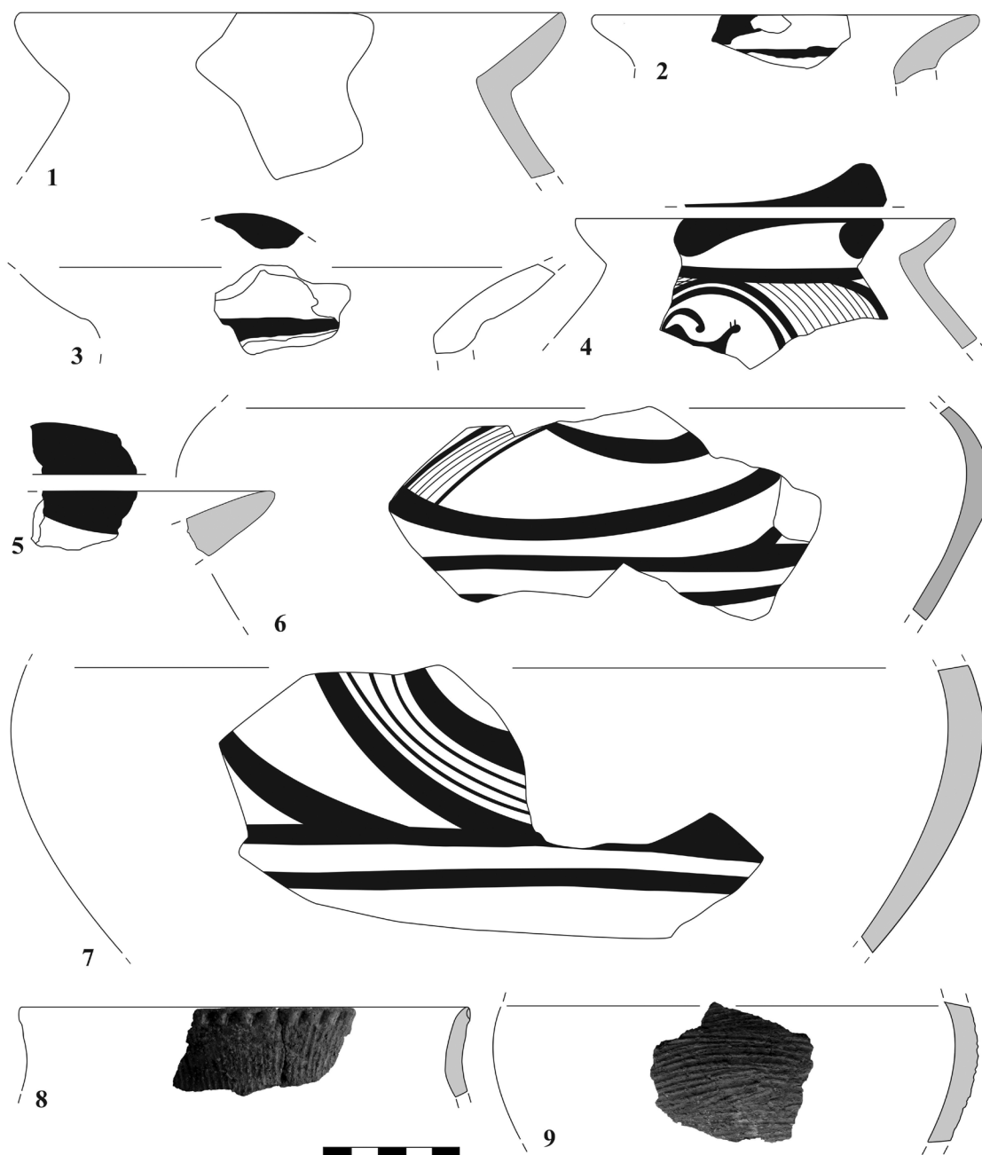
Рис. 1. Гетьманівка I, кераміка I (8, 9) та II (1–7) категорій

Споруда 1, очевидно, є двоповерховою. Знайдено вимостку було споруджено на земляній підлозі. Дерев'яний настил та намазаний на нього потужний шар глини є перекриттям першого поверху. І, нарешті, поодинокі фрагменти обпаленої глини, виявлені на міжповерховому перекритті, можуть бути конструктивними елементами від стін чи перекриття другого поверху. Дерев'яний настил перекриття першого поверху