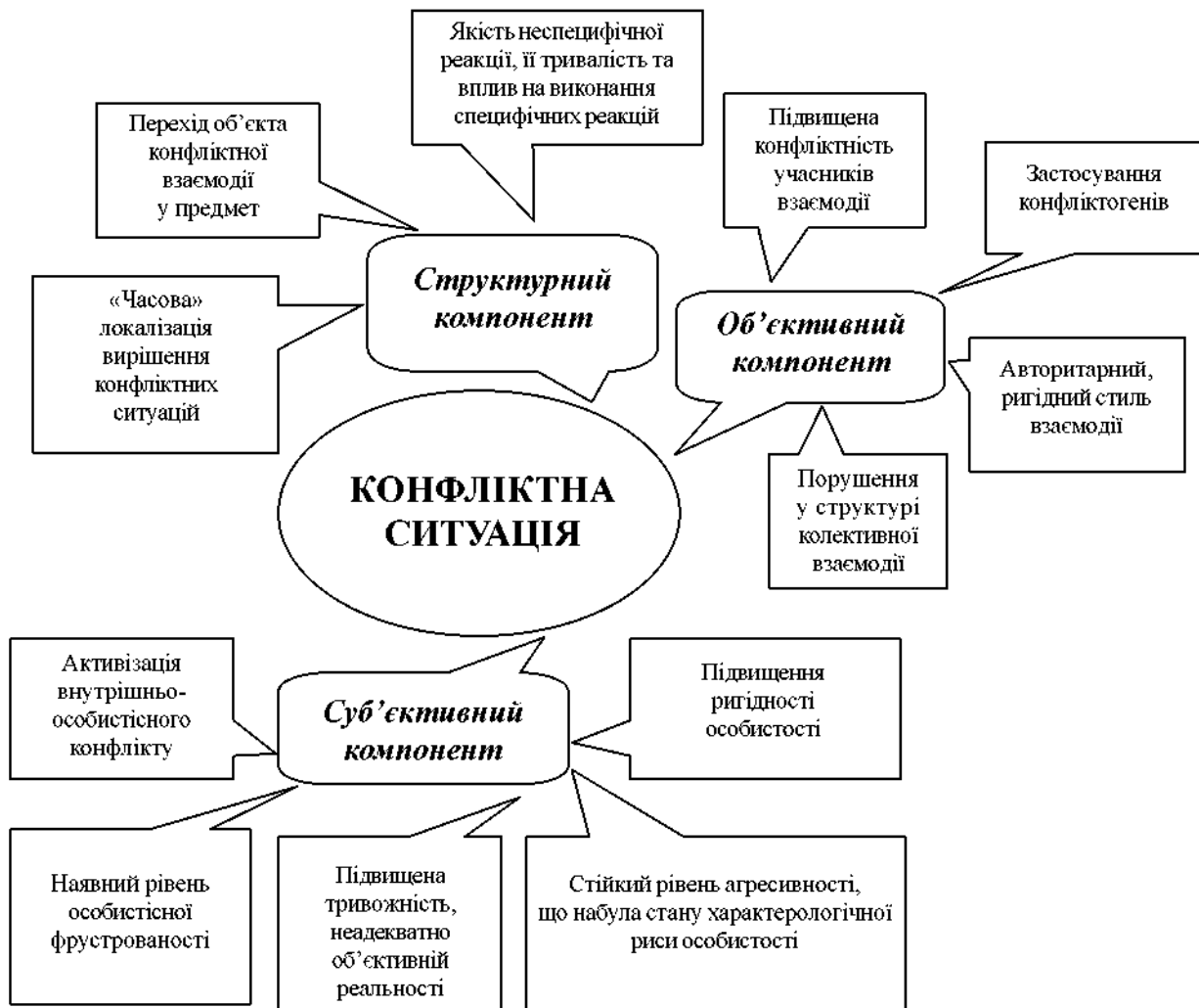
Рис. 1. Психологічні компоненти – складники конфліктних ситуацій у міжособистісній взаємодії як умова їх розв'язання

Об'єктивний компонент визначається специфікою адаптації, соціалізації та провідною діяльністю особистості у пізньому юнацькому віці. Даний компонент ми характеризуємо з позиції специфіки навчально-виховного процесу, що являє собою єдність цілей, змісту і засобів, який безпосередньо реалізується й підтверджується