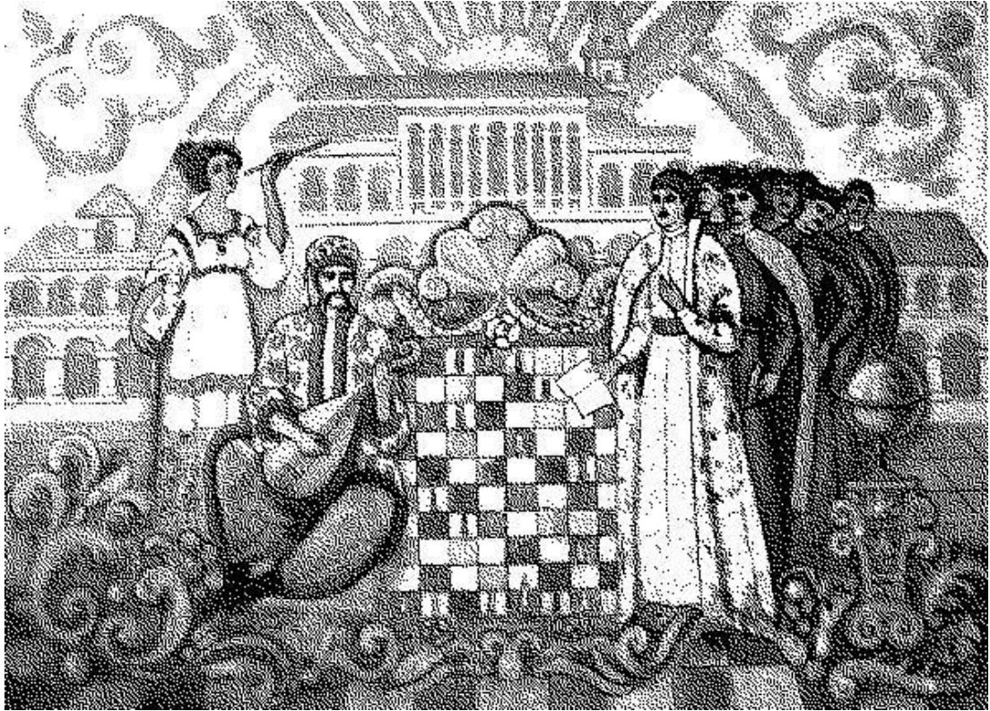
Ольга Ворона, дипломна робота (1987), 2м х 3м, полотно, олія.