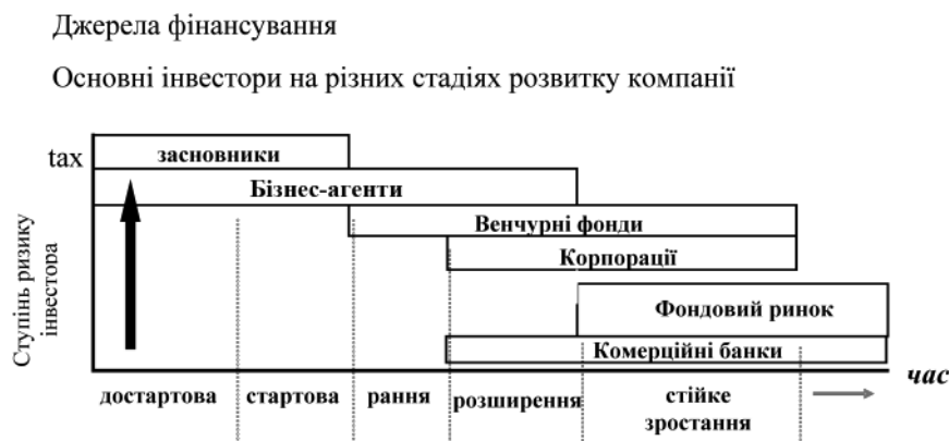
Рис. 2. Джерела фінансування

на система впровадження національної інноваційної моделі, що призводить до розривів між учасниками інноваційно-інвестиційного процесу і неефективного витрачання бюджетних коштів. Державне фінансування повинно сприяти активізації інноваційно-інвестиційного ринку і створенню відповідної інфраструктури (див. рис. 2). Розриви у державному управлінні, відсутність системи гальмують процес перетворення інновації на товарно-інтелектуальну складову інвестицій, не сприяють активізації ринкових процесів і залученню бізнесу