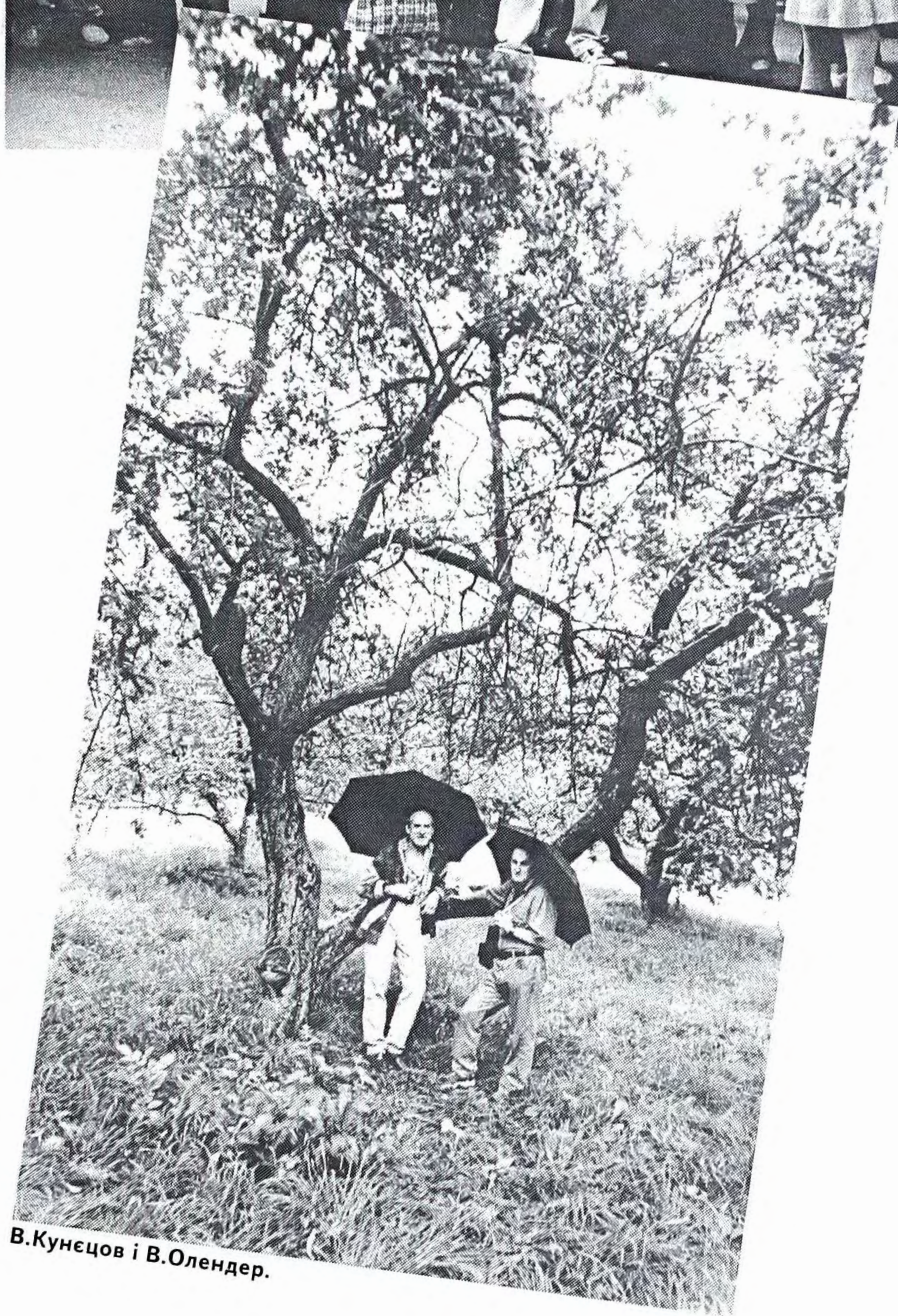
В.Кунцов і В.Олендер.