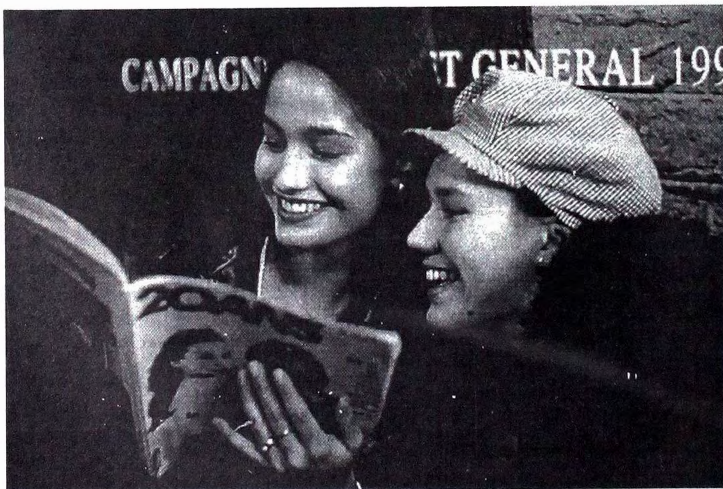
Кадр із фільму "Приманка". Режисер Б.Таверньє. Франція.

І саме в майбутнє нашого кіно була спрямована перша велика акція "Свема". Вона полягала в підвищенні престижу фестивалю, можливості розширення міжнародних контактів і донесенні інформації про реальний стан кіно на Заході до українських студентів, які повинні знати чого очікувати від завтрашнього дня. Присутність на фестивалі та робота в журі Анрі Варіссельта, вченого секретаря Міжнародної асоціації кіношкіл світу "CILECT" була запорукою того, що міжнародна громад-