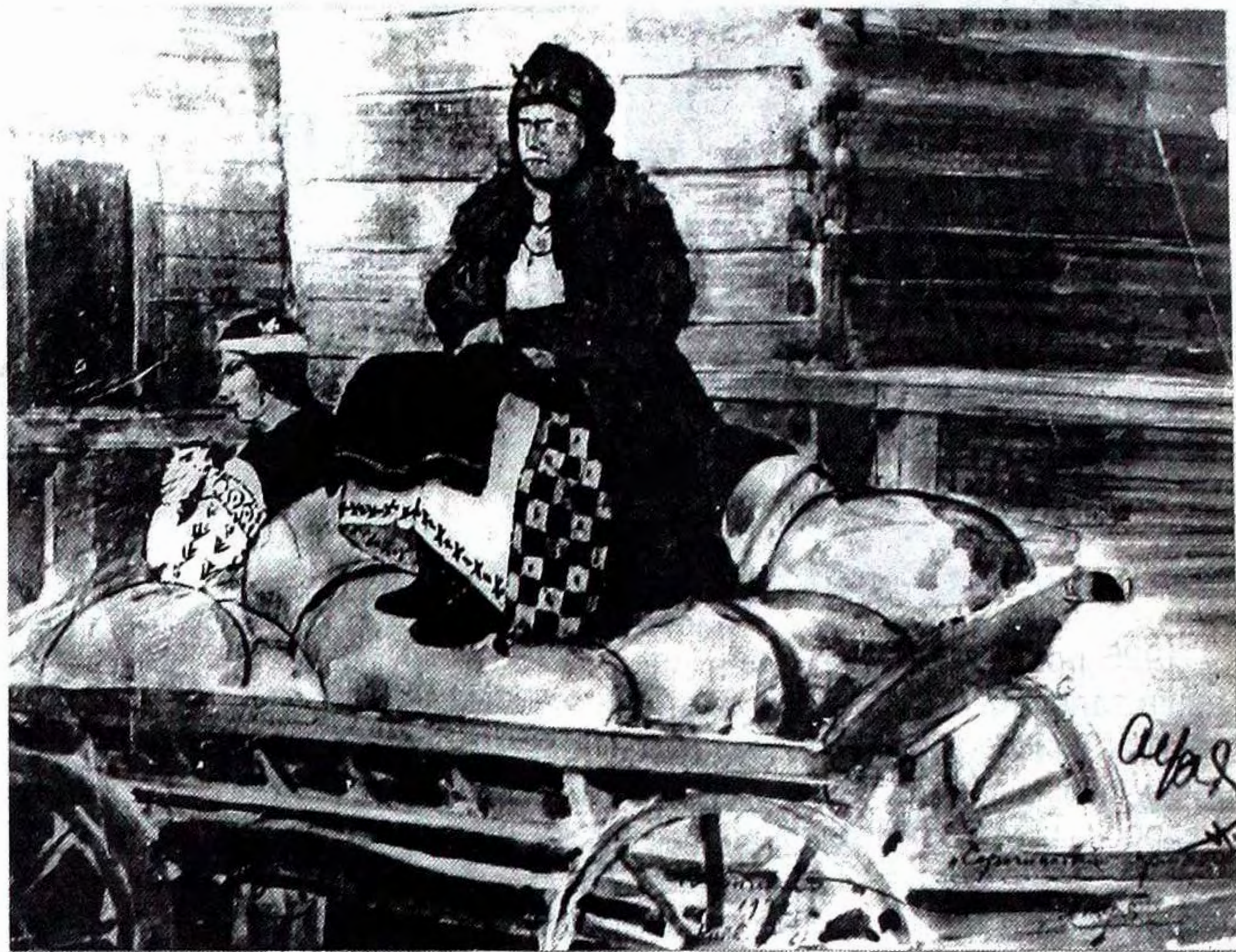
Василь Кричевський. Ескізи до фільму "Сорочинський ярмарок". 1938.

прагне, щоб у фільмі не було ніякої поетизації побуту, але й ніякої фальші і безграмотного зневажання подробицями." / "Кіно", Київ, 1926, №12/.