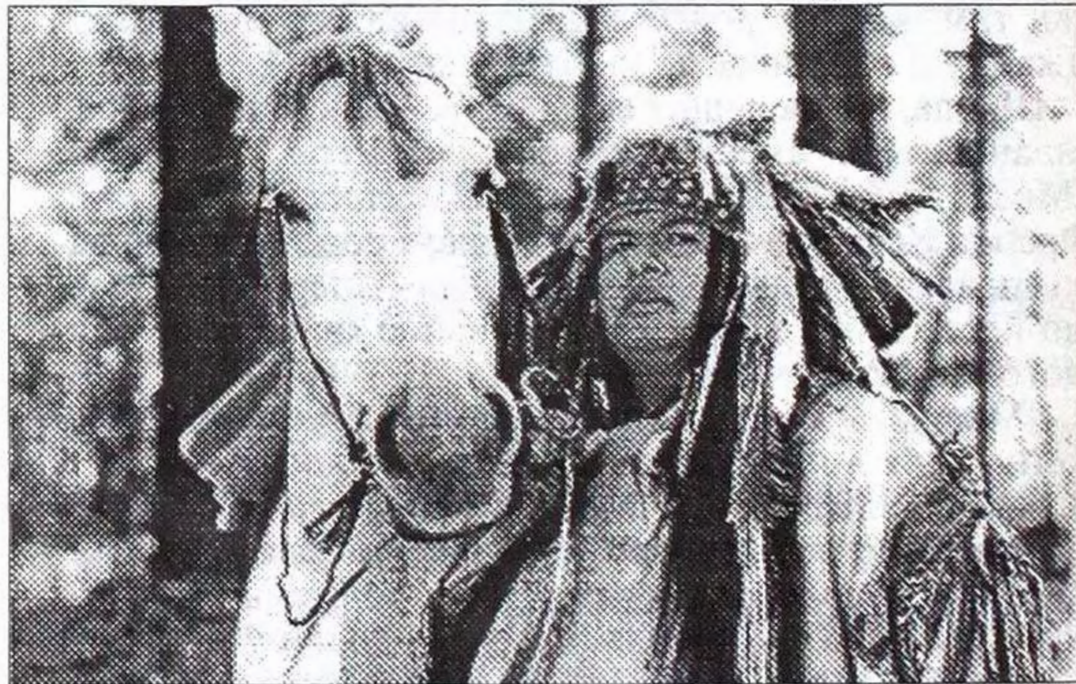
Кадр із фільму "Мрець". США, 1995.

У статті використані матеріали, опубліковані в журналах "Cahiers du cinema", №498 (Франція); epd Film №1, 1996 (ФРН); "Cinema", №1, 1996, (США).