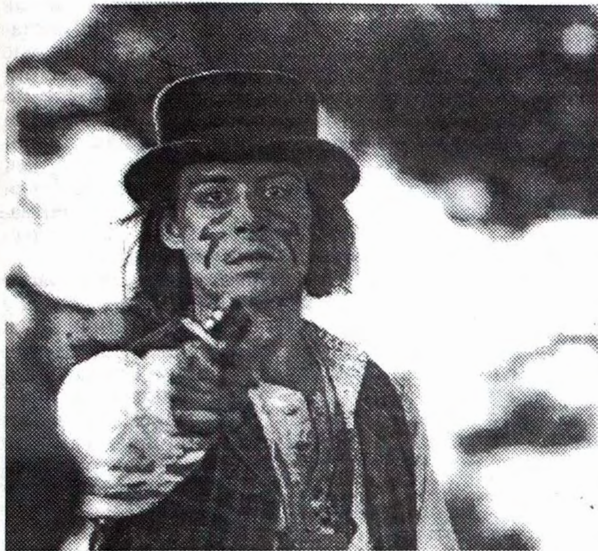
Джонні Депп у фільмі "Мрець". Режисер Д. Джармуш. США, 1995.

"Ти - покійник!" - кричать ворогові у вестернах, перш, аніж вихопити револьвер. Але того, кому обіцяють смерть, не конче уб'ють - у нього можуть не вцілити, він може встигнути вистрілити першим. Героя останнього фільму Джима Джармуша "Мрець", режисер з перших кадрів відправляє до пекла, тим не менше, той продовжує жити і навіть вбивати після своєї смерті. Тому що картина Джармуша - вестерн тільки за формою. Насправді це кінопритча, суть якої зовсім не просто осягнути глядачеві, який не задумувався над тим, що так довго обдумував автор. Вісім років Джармуш готувався до цього фільму.