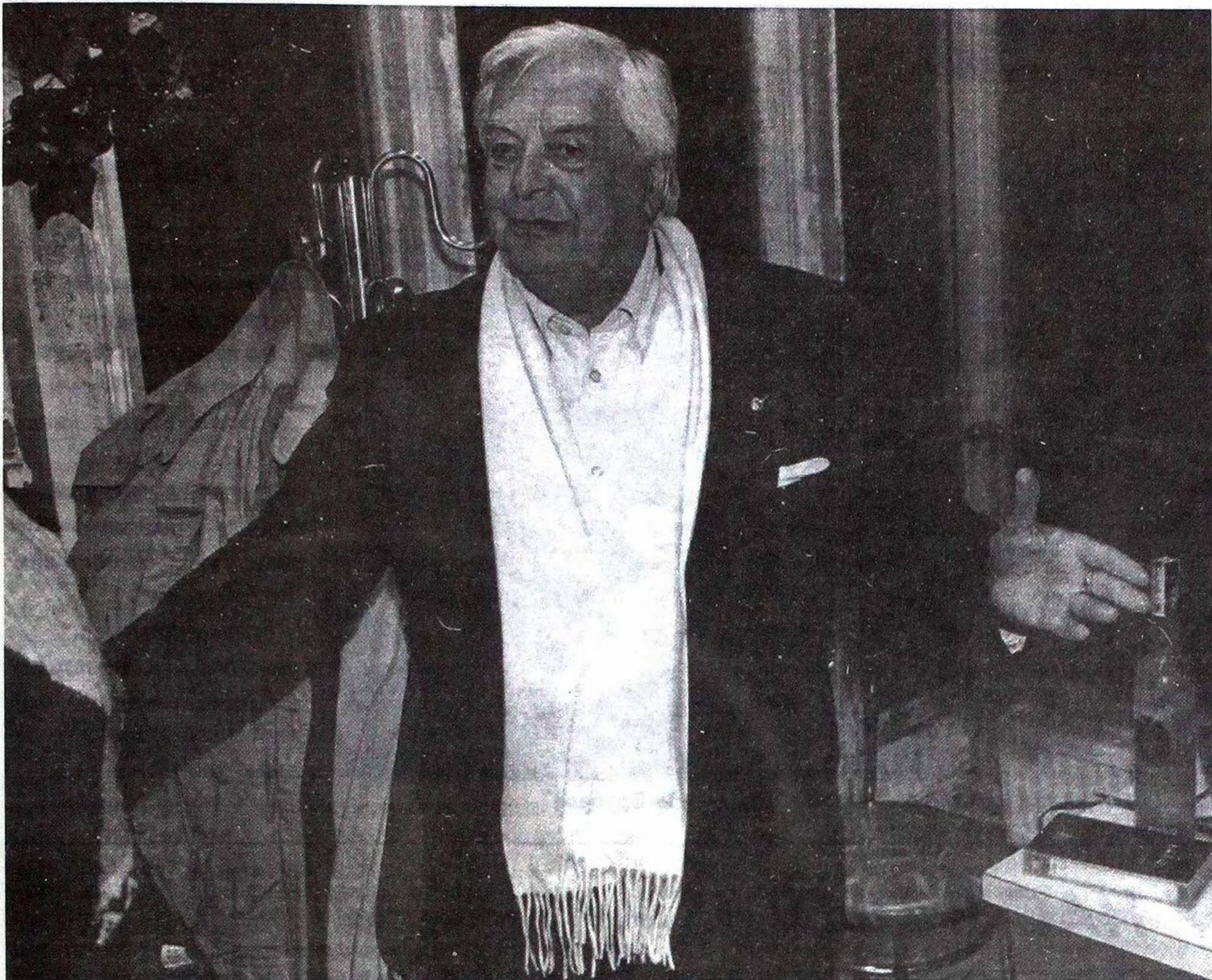
Юрій Любимов, 1996.

всі "технічні хитрощі" та "фотографічні цікавинки". Автор наче б то усуває самого себе. Тим самим відкриває глядачеві "вікно в життя", де в центрі - людина. Вона бо й оживлює, одуховнює і заповняє всю світлину. І в цьому непростота простої фотографії Віктора.