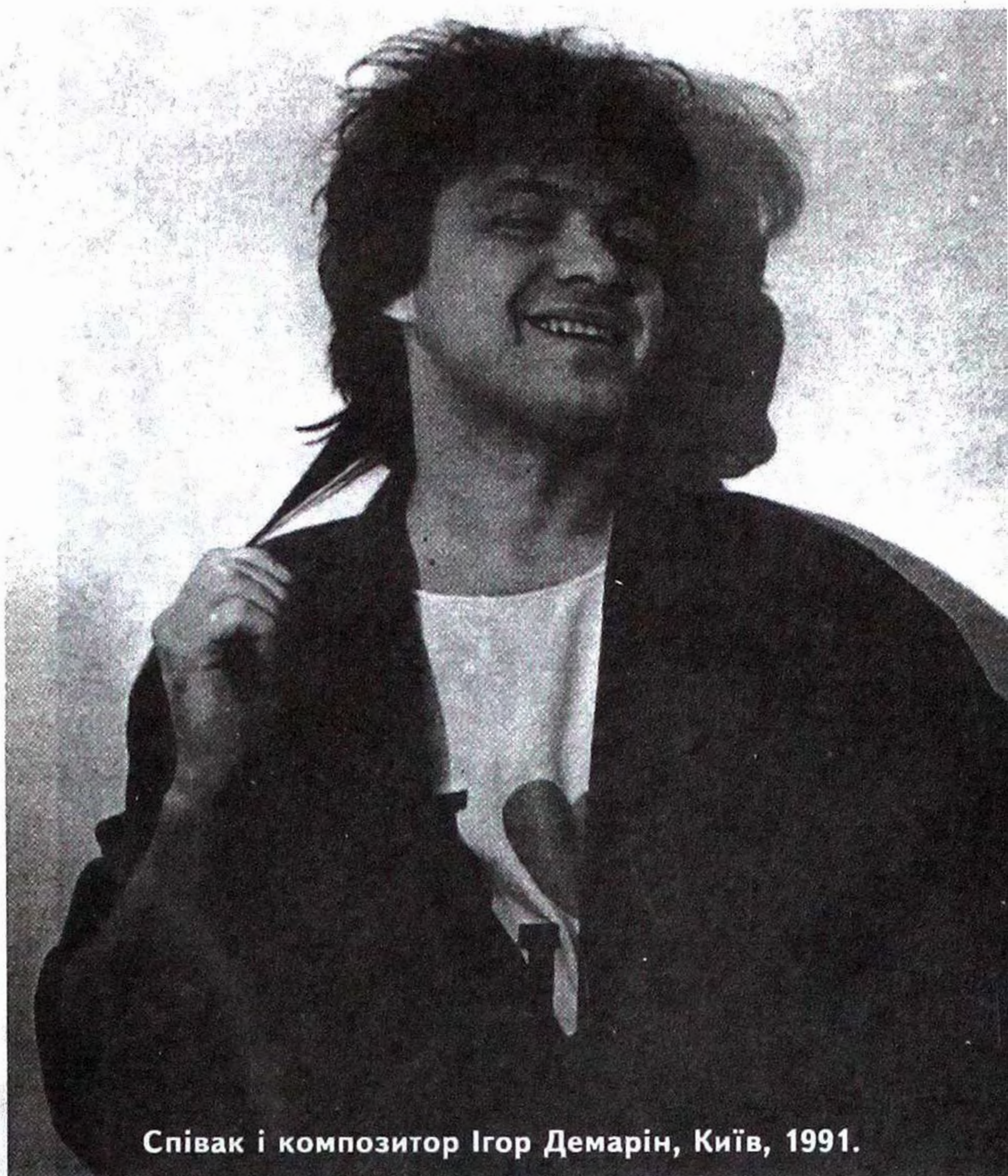
Співак і композитор Ігор Демарін, Київ, 1991.

Інколи здається, що в Україні зупинили час три глобальні катастрофи. Перша - Чорнобильська аварія, яка опалила ойкумену, тіло і душу України та оповила всю планету радіаційним шлейфом.