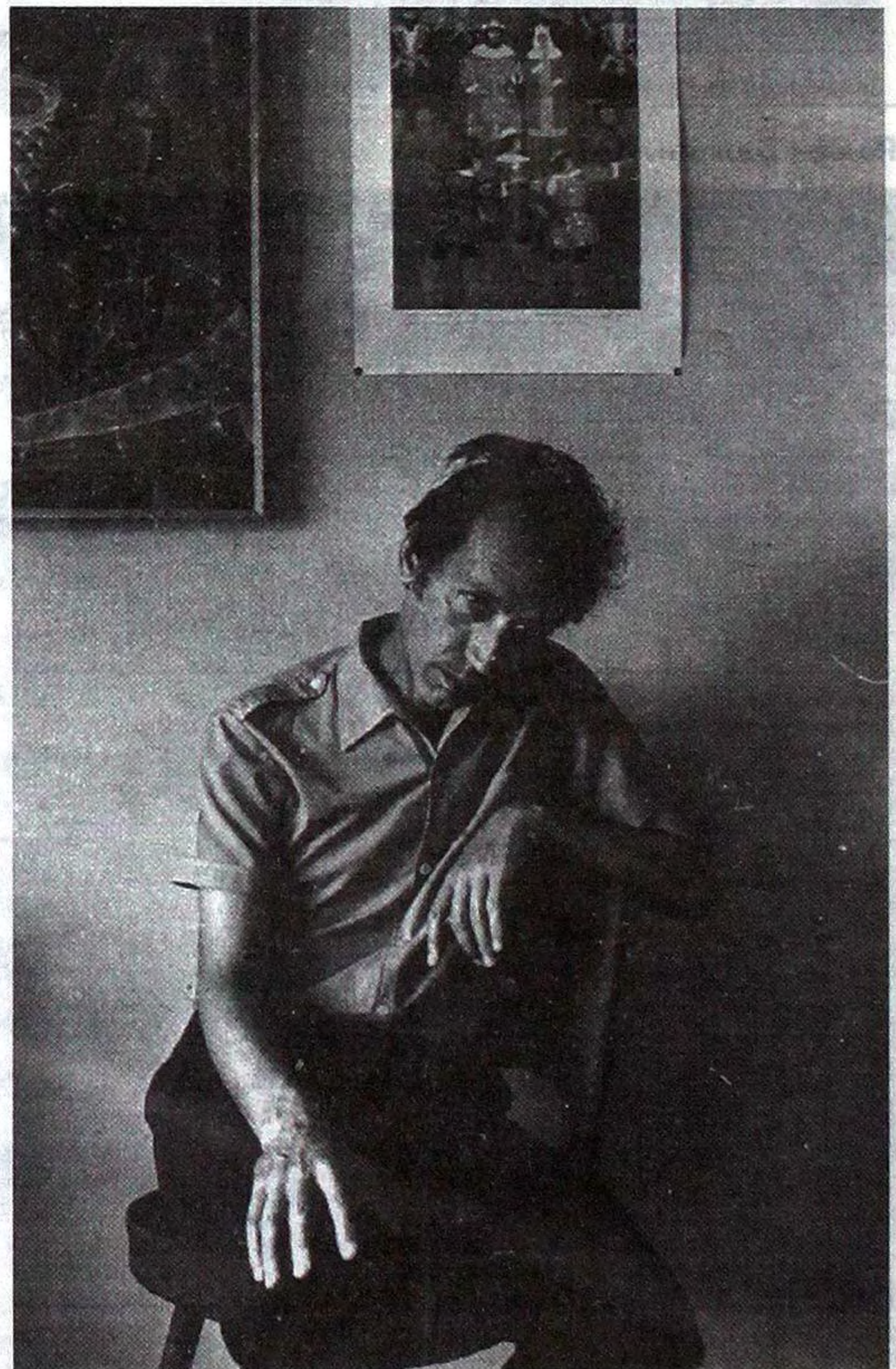
Композитор Валентин Сильвестров. Київ, 1984.

Віктор Марущенко належить до тих небагатьох, котрим не варто було в ці буремні роки заново "шукати себе" або "перелаштовуватися". Виявилося, що він завжди працював у власних координатах бачення та відчуття часу, подій і людей. І саме світлина радянського періоду свідчать про це. Віктор Марущенко шукає візором апарату людину з її навколишнім і внутрішнім світом, а не загальний антураж, парадність або красивість. Навіть тоді, коли фотографує комуністичні символи чи хор ветеранів у парадних військових формах. Його знімки, на перший погляд, прості - в них немає й сліду навмисних ускладнень та алегоричності. Його цікавить людина "сама по собі", "сама з собою", "сама з іншими", "сама зі світом". А щоб нічого не вадило цьому принципіві, він рішуче вимітає з кадру