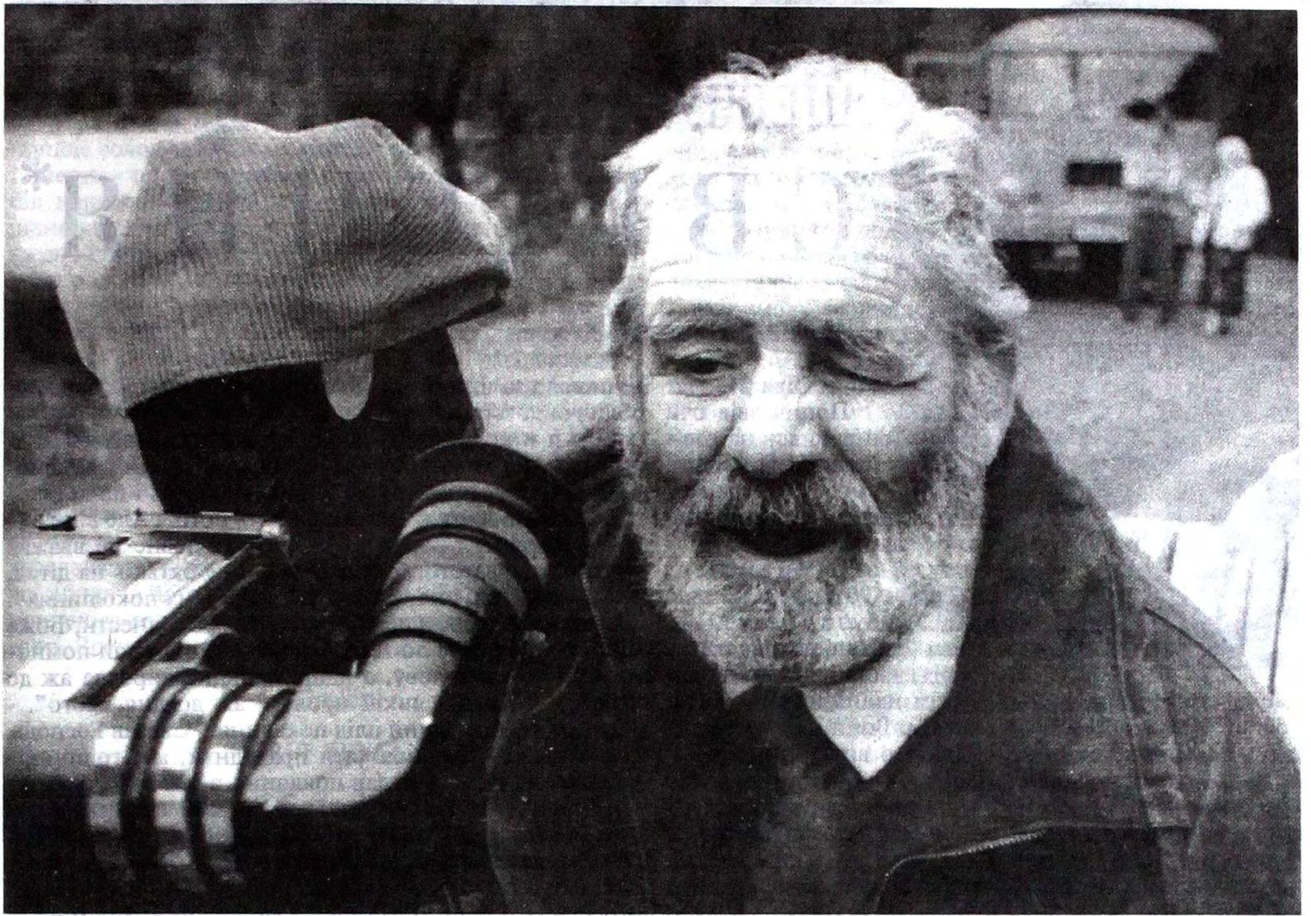
Пуца-Водиця, вересень, 1992.