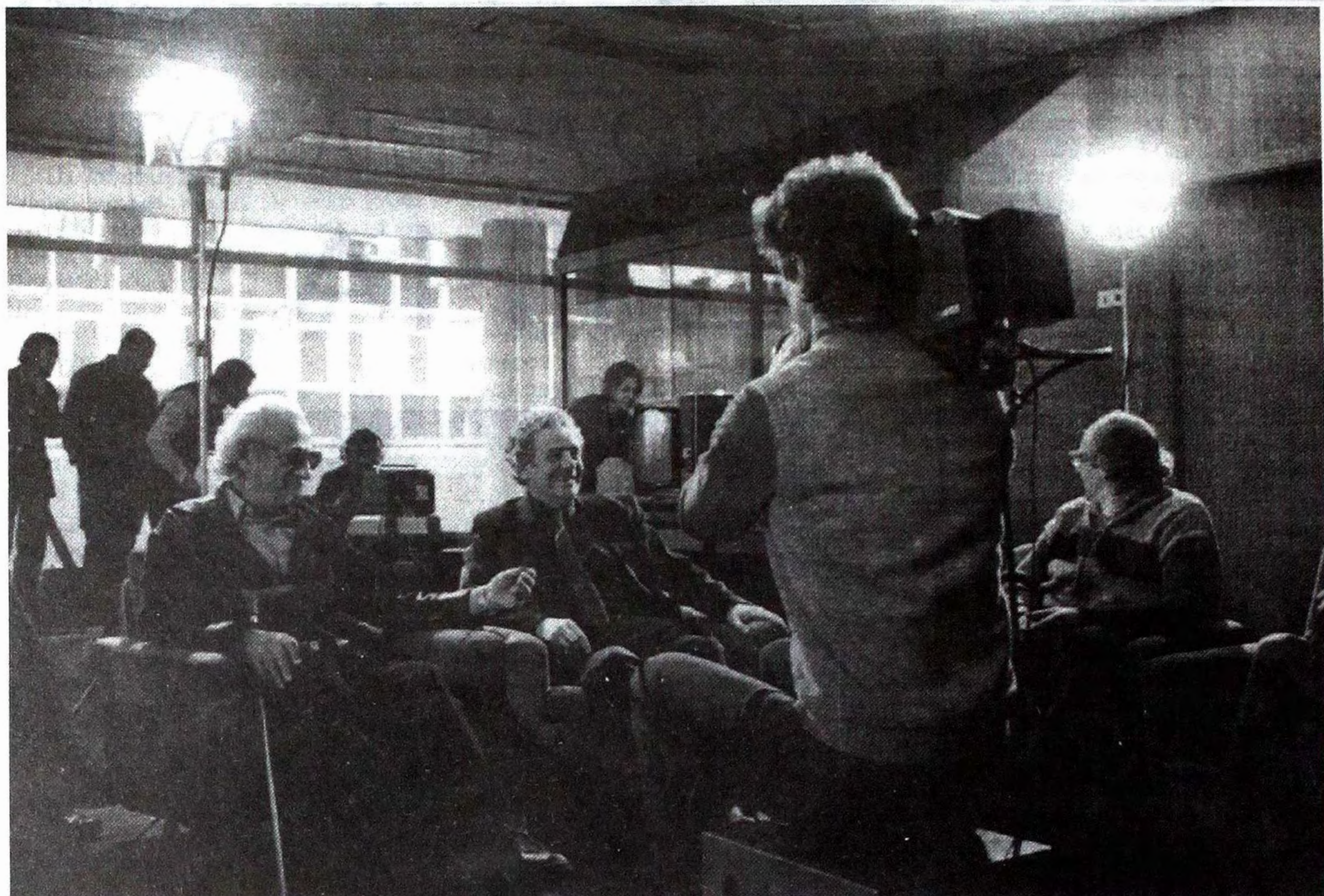
Засідання круглого столу. 1988.