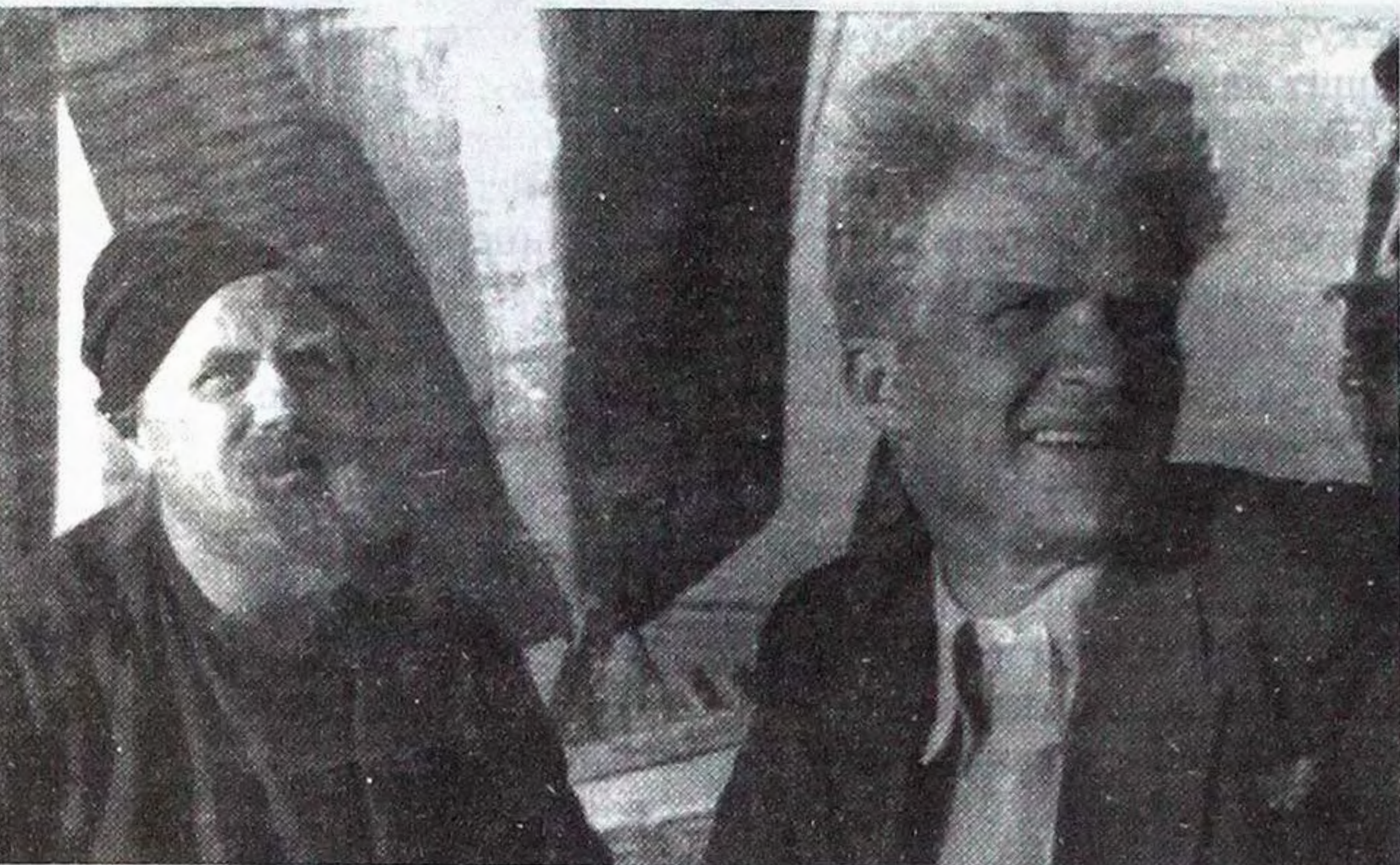
М.Жаров та І.Савченко на зйомках фільму "Богдан Хмельницький".

злякався труднощів роботи з молодим актором, якому явно ще бракувало життєвого досвіду та професійної майстерності, щоб втілити в образі всю пристрасність великих думок і почуттів геніального поета.