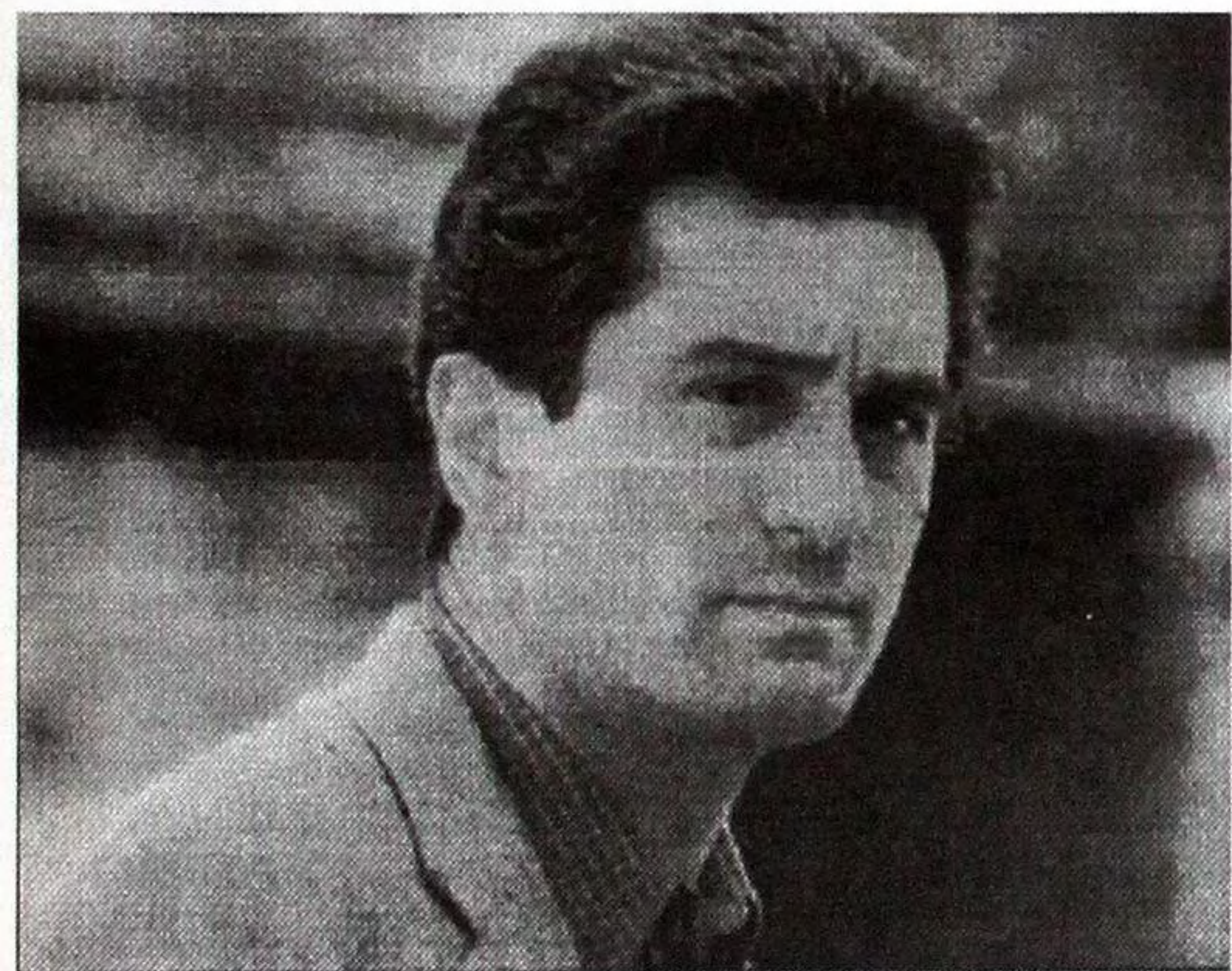
Роберт де Ніро.

Скромнішою була прем'єра "Полювання на метеликів", яку