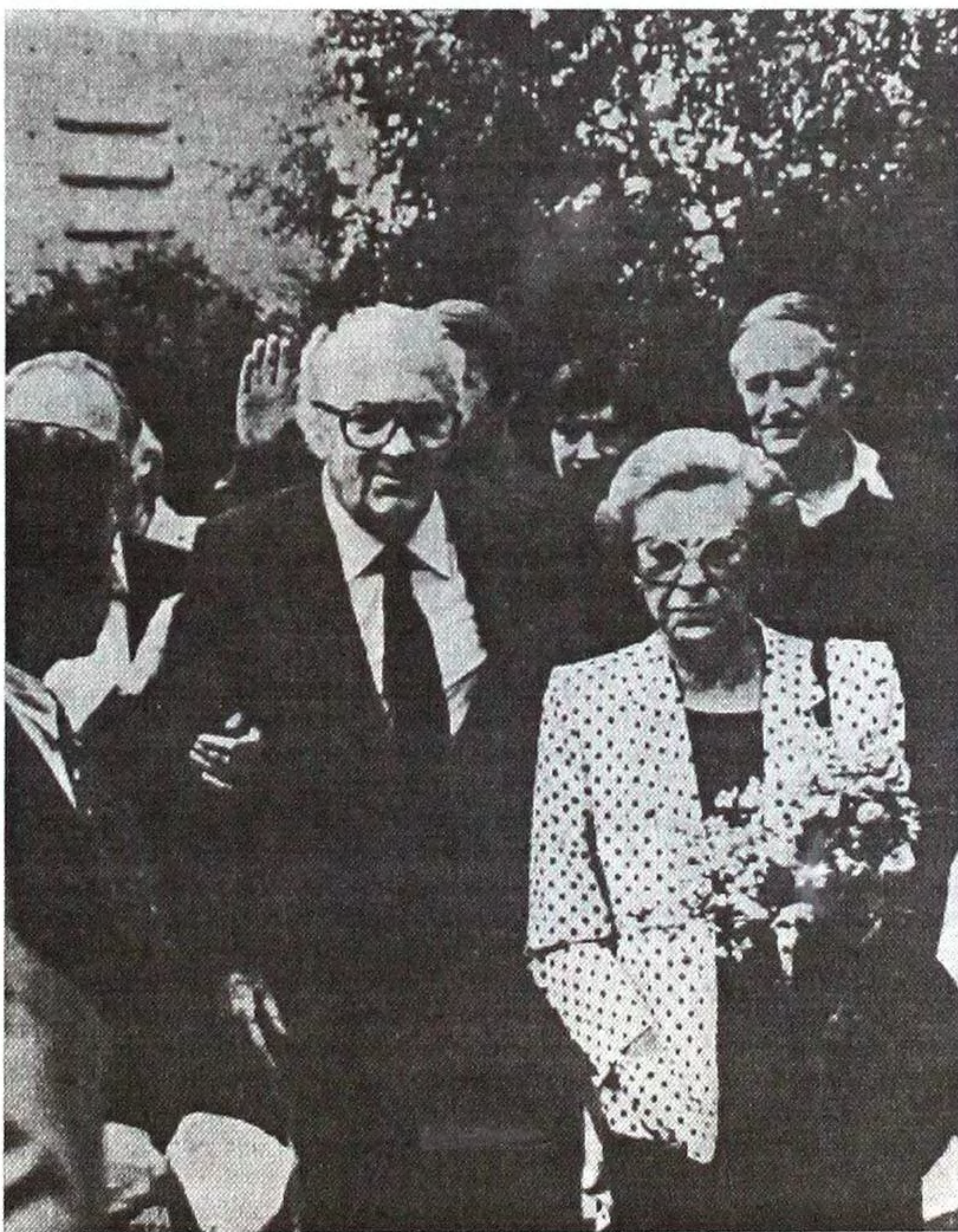
Федеріко Фелліні та Джульєтта Мазіна на ХV Московському МКФ.