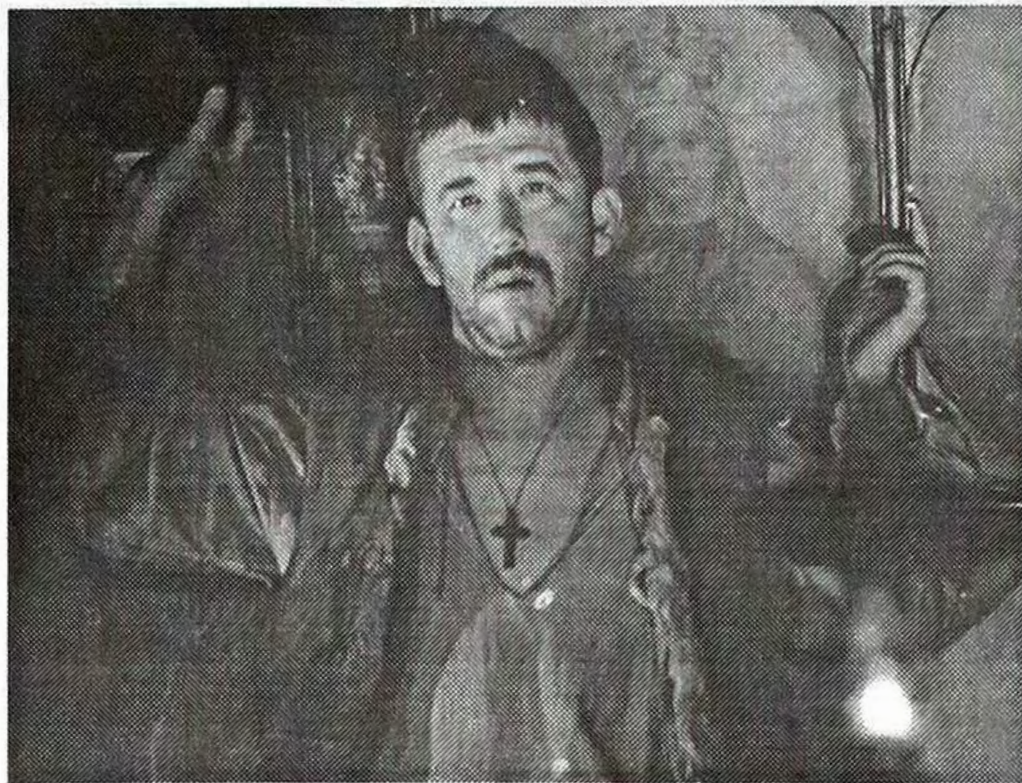
Кадр з фільму «Камінний хрест». Режисер Л.Осика. 1968.

закликала кінематографістів «активно і вміло пропагувати комуністичні ідеали», наводилися факти порушення цих «норм»: «такі фільми Одеської кіностудії, як «Від снігу до снігу», «Короткі зустрічі» та інші свідчать про недостатню вимогливість керівництва студій і Комітету по кінематографії до ідейного і художнього рівня створюваних кінотворів» (ЦДАВОВ, фонд 4754, опис 1).