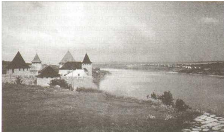
Хотин. Турецька фортеця.

письменник і хоча б з пошани до цього таку табличку, встановлену державою, треба було б зберегти.