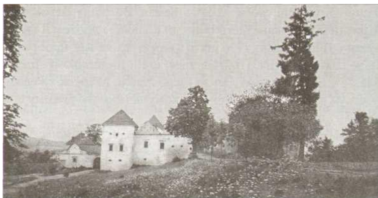
Свірж. Княжий замок. 1530 р.