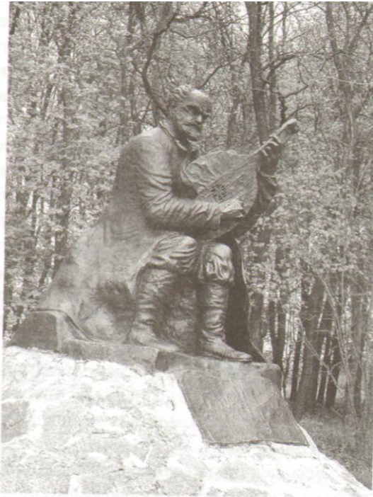
Чернігівщина. Пам'ятник знаменитому кобзарю Остапу Вересаю на його батьківщині в селі Сокиринці.

Євпаторією, яка готувалася до свого 2500-ліття і, зокрема, побачив там повну відсутність української преси в кіосках... «Союзпечати».