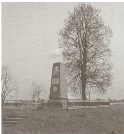
Село Пальчики. Могила пасічника Петра Івановича Прокоповича.

зиденту, який полюбляє пасічництво, заїхати на могилу Петра Прокоповича (1775 — 1850) — вихованця Києво-Могилянської академії, бджоляра-реформатора, як тут же на трасі було встановлено щит з вказівкою, що до могили видатного вченого 300 метрів. Тепер кожен, хто проїжджає автотрасою