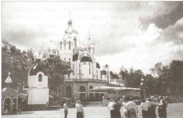
Тернопільська область, село Зарваниця. Собор Зарваницької Божої Матері.

вересні 1655 р., а у Жашкові на Київщині навіть не чули, що поруч у січні 1655 р. була ще одна переможна битва (Охматівська або ж Дрожипільська). І це при тому, що вже наступного року виповнюється 350-ліття цих знаменних подій! Навіть найкращі з існуючих та доступних путівників є неповними й неточними. На них не вказані навіть такі історичні міста як Бар, Браїлів, Підгайці, не кажучи про Браїлівську перемогу козаків Петра Дорошенка над польськими військами С. Маховського у 1667 р. чи напівзруйновані синагоги у Дрогобичі та Ялтушкові.