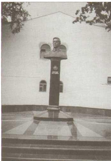
Рівне. Пам'ятник Симонові Петлюрі.

Окремо слід сказати й про карти. Справа навіть не в