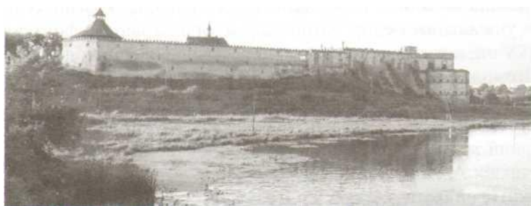
Рівненщина. Меджибіш. Фортеця XVII ст.

Характерно, що в наших численних розмовах та інтерв'ю, насамперед з простими селянами, жоден із співрозмовників не шкодував за СРСР, жоден не праг повернення у