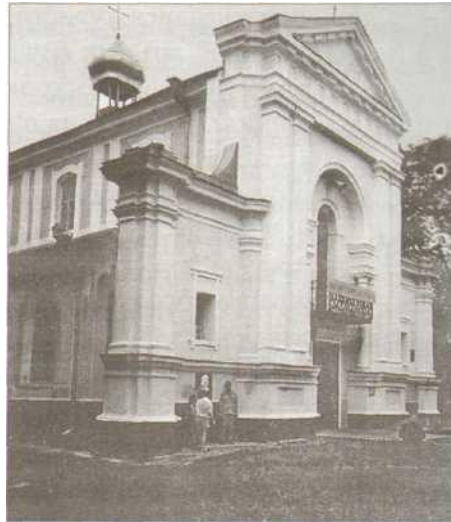
Бердичів. Костел Святої Барбари, у якому вінчалися Опоре де Бальзак і

Дещо далі лежить Качинське озеро, на якому людина купається поруч з дикими лебедями, бо тут взагалі немає туристів. У волинських селах кожен може помилуватися живою, а не муміфікованою чи телевізійною природою. У повітрі ширяє різне птаство, доводилося бачити багато лелек, журавлів, диких качок та шулік, частенько траплялися заїці, їжаки.