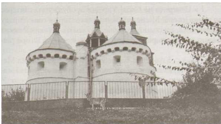
Хмельницька область, село Сутківці. Церква-фортеця XV ст.

А взагалі всі ми — українці, чи то холмщаки, чи то чорноморці, чи то галичани, чи то полтавці!