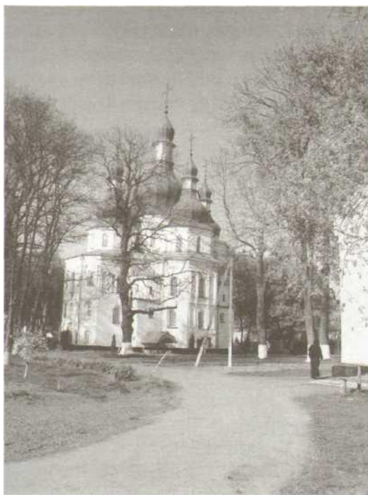
Чернігівщина. Густинський монастир.

рода Конотопа... расположен нїне Крупницький мона- стырь...». (Нага- даємо, що брошу- ру було видано у 2003 р., коли вже не існують ніякі «уезды» та й «вер- стами» відстані давно вже не мі- ряють). Не сказа- но навіть, що мо- настир стоїть в Україні! Як прави- ло, в найгірших московських вели- кодержавно-шові- ністичних тради- ціях такі слова, як «Україна», «укра-