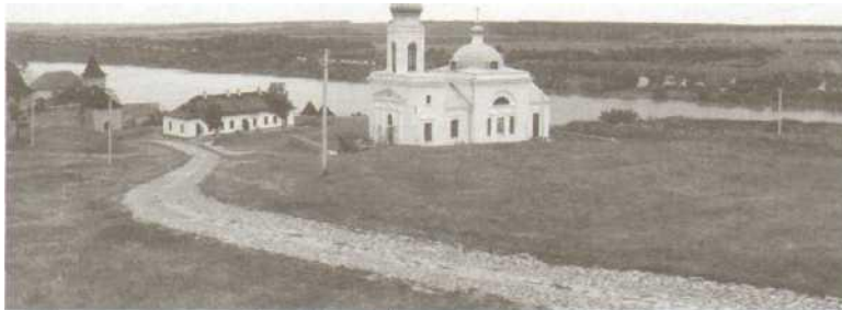
Храм Олександра Невського під мурами Хотинської фортеці.

бливо після дощу. Не краща дорога і з Острога до села Дермань, славного своїм монастирем з чудотворними іконами і тим, що в ньому народився видатний український письменник Улас Самчук (до речі, у місцевій школі ентузіасти на чолі з учителем історії створили гарний музей на честь письменника). Важким був і відрізок шляху з траси Хмельницький — Ярмолинці до Сутківців. Це красиве село з унікальними спорудами (дивом уціліла церква-фортеця XV ст., а також рештки замку) розташоване при під'їзді до Ярмолинець з боку Хмельницького всього за 3 км від прекрасної траси зі жвавим рухом. Та проїжджі мчать мимо, не відаючи, що буквально поруч зберігався такий неповторний храм (немає навіть примітивної таблички — покажчика!). А по-друге, якщо й довідаються, то навряд чи зважаться з'їхати з траси на страшенно поруйновану дорогу до Сутківців.