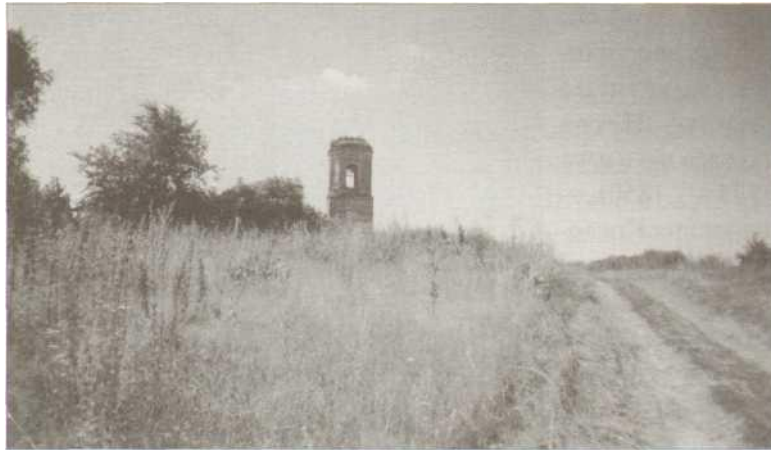
Чернігівщина, село Максаки. Дзвіниця Спасо-Преображенського монастиря, заснованого у XVII ст. православним сенатором сейму Речі Посполитої Адамом Киселем.

Преображенський монастир у с. Максаки Менського р-ну, де свого часу ігуменом був св. Димитрій Ростовський, перебуває в жалюгідному стані, через що ця велична пам'ятка взагалі може бути невдовзі цілковито втрачена.