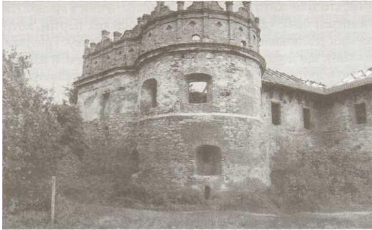
Старокостянтинів. Башта фортеці князя К. Острозького.

їнський народ, українську мову й культуру. При цьому надзвичайно високим залишається у простих селян і мешканців маленьких містечок авторитет торік відстороненого від влади прем'єр-міністра України Віктора Ющенка. Жоден з тих, з ким довелося розмовляти на Правобережжі України, не сказав жодного поганого слова про Віктора Андрійовича, навпаки, кожен підкреслював, що саме за його прем'єрства відбулися, нарешті, хоч якісь позитивні зміни в житті простих людей. Без сумніву, якщо Ющенко висуне свою кандидатуру на наступних президентських виборах, то неодмінно переможе!