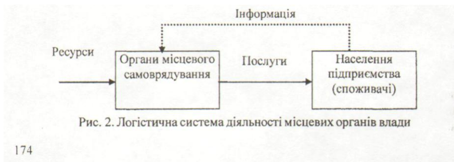
Рис. 2. Логістична система діяльності місцевих органів влади