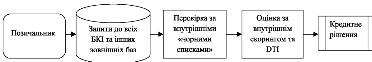
Рис. 4. Організація системи ризик-менеджменту на основі критерію операційної ефективності

зіставлення даватиме можливість прийняти більш виважене кредитне рішення.