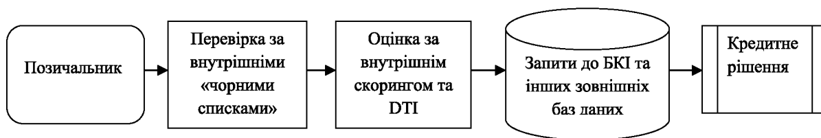
Рис. 2. Організація системи ризик-менеджменту на основі критерію мінімізації витрат

обміну. Дослідження автора доводять, що на цьому етапі відкидається в середньому близько 20 % від загальної сукупності відхилених заяв. На наступному етапі аплікант оцінюється за внутрішніми правилами та процедурами, основними серед яких є корингування внутрішнім скорингом та оцінка кредитного навантаження (розрахунок показника ДТІ). За дослідженнями автора, на цьому етапі відтинається в середньому 15 % від загальної сукупності відхилених заяв та на основі інформації з бюро кредитних історій відхиляється 65 % від загальної сукупності відхилених. Через те, що інформація з бюро кредитних історій надається на платній основі, кредитор економить кошти. Таким чином, процес «проходження» аплікантів через складові ризик-менеджменту у кількісному вимірі можна охарактеризувати так: