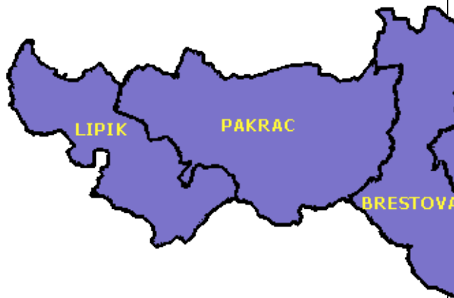
Picture 4. Segments of Metel Win users in Pozega- Slavonia County

Research was created with interviews with library managers and users in librarians in Pozega-Slavonia County, which use Metel Win application, sample (n=25)