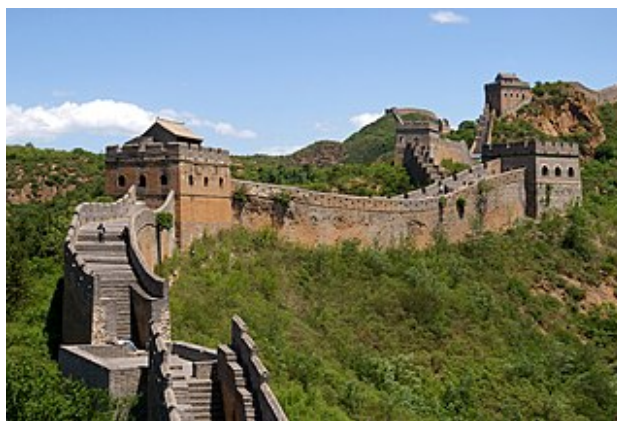
Великий китайський мур

Серед усього переліку до нашого часу збереглися лише піраміди в Гізі.