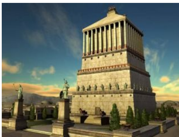
Мавзолей у Галікарнасі. Реконструкція

Сім чудес світу — буквально — перелік шедеврів архітектури Стародавнього світу, що символічно складається з семи назв. У широкому розумінні — сталий фразеологізм для позначення найдивовижніших та найвідоміших артефактів, створених людиною.