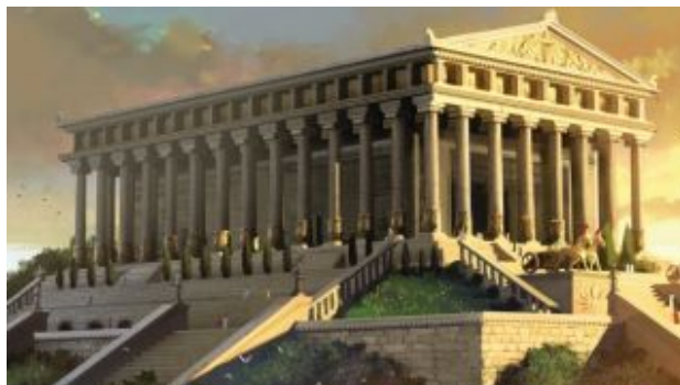
Храм Артеміди. Реконструкція