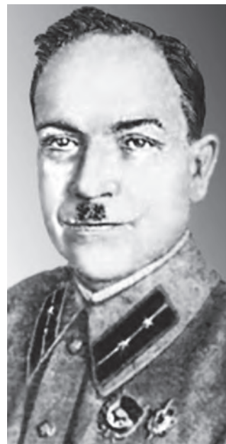
Василь Тимофійович Іванов (1937 р.)

чальника Київського оперативного сектора ДПУ УСРР Василя Тимофійовича Іванова підкреслювалась «посидючість, ініціативність і наполегливість доброго агентуріста та слідчого Брука», який за останній період «добре попрацював» і, зокрема в останній період вміло проробив і ліквідував повстанські справи «Втікачі» і «Компанія», досяг позитивних результатів у слідчій роботі по справі «Весна». Разом з тим начальник Київського оперативного сектора ДПУ відзначив, що Брук «в роботі використовує ризиковані методи, які можуть звести нанівець його успіхи у слідчій роботі. Як і раніше він недостатньо витриманий і дисциплінований, крім того під впливом успіхів в роботі в ньому виявляється риса чванливості. З великим трудом визнає свої помилки. Керувати підлеглими йому співробітниками ще не навчився та відмовляється. По посаді, що займає, потребує посиленого керівництва та тиску» 48 .