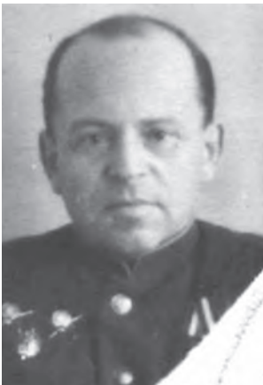
Борис Ізраїльович Борисов-Коган (1950-ті рр.)

Косіора, Павла Постишева. Опираючись на сфальсифіковані матеріали попереднього слідства за участі С Брука та його колег з секретно-політичного відділу Військова колегія Верховного суду СРСР 21 жовтня 1936 р. засудила до розстрілу 37 осіб, більшість з яких були викладачі українських вузів та наукові співробітники Всеукраїнської асоціації марксистсько-ленінських інститутів (ВУАМЛІН) та АН УСРР. Серед них: професор фізики Київського університету Лев Штрум; професор кафедри стародавньої історії Київського університету (1930-1936) Григорій Лозовик 62 ; викладач історії в Київському педінституті ім. О.М. Горького Лев Сахновський 63 ; філософ Яків Розанов (у 1922-1928 рр. завідувач Київською Центральною Робітничою бібліотекою ім. ВКП(б)); викладач діамату у Київському лісотехнічному інституті в 1931-1934 роках Гнат Звада 64 , професор математики Київського університету, доктор фізико-математичних наук, член-кореспондент АН Української СРР Михайло Орлов та ін. Як свідчать архівні документи Соломон Брук в якості помічника начальника СПВ УДБ НКВС УСРР був присутній в ніч на 22 жовтня 1936 року у спецкорпусі внутрішньої тюрми НКВС УСРР під час процедури умирення педагогічних працівників та вчех і своїм підписом засвідчив акт розстрілу 37 учасників української троцькістсько-націоналістичної бойової організації.