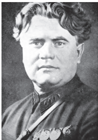
Всеволод Аполлонович Балицький (1932 р.)

Ймовірно Соломон Брук зробив певні висновки оскільки в черговій характеристиці на-