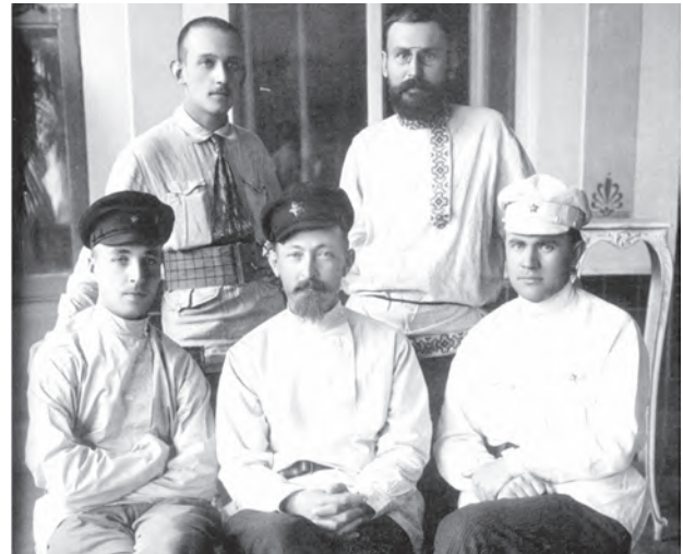
Харків. Літо 1920. Сидять зліва направо: Василь Манцев – начальник ЦУПНАДКОМу, Фелікс Дзержинський, Всеволод Балицький – заступник начальника ЦУПНАДКОМу

Русопятства я не замечал, да и жалоб не слышал. В области моей специальности – здесь обильный урожай. Вся, можно сказать, интеллигенция средняя украинская – это петлюровцы... Громадной помехой в борьбе – отсутствие чекистов-украинцев» 17 (прикметно, що виділені нами слова не увійшли до радянських 18 та сучасних російських видань, присвячених діяльності Ф.Е. Дзержинського 19 ).