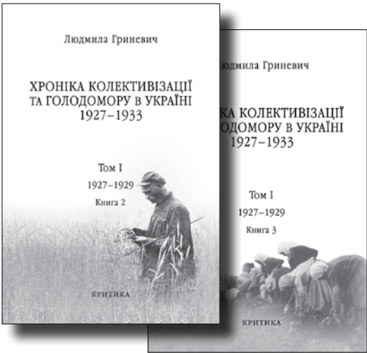
Людмила Гриневич Хроніка колективізації та Голодомору в Україні Том I Початок надзвичайних заходів Голод 1928–1929 років Книги 2 і 3

Решту довідок про авторів цього числа «Критики» див. на с. 40 =>