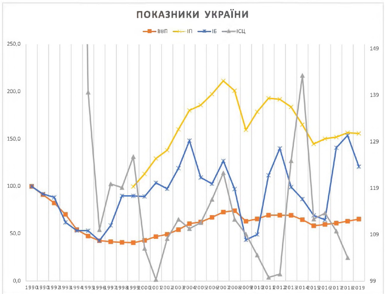
Рис. 1. Показники України: Валовий внутрішній продукт (ВВП), Індекс промисловості (ІП), Індекс будівництва (ІБ), Індекс споживчих цін (ІСЦ).

У наведеній діаграмі можна побачити динаміку обраних показників. Так як бізнес-цикл вважається завершеним, коли, після кризи, показники перевершують докризовий рівень, наведені дані валового продукту, індексу промисловості і будівництва переставлені кумулятивним методом з базовими роками 1990 і 1998 (перший рік обрахунку індексу промисловості).