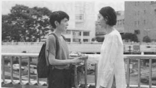
Кадр з фільму «Колеса фортуни і фантазії». Рюсукі Тамагучі. Японія.

Увагу кінокритиків привернула «Коробка пам'яті» Джоани Хаджі Тома і Халілі Джорейге (Ліван. Канада. Катар, Франція). Дівчинка-тінейджер з добре влаштованої в Канаді емігрантської ліванської родини знаходить теку з якимись архівними матеріалами. Попри заборону матері торкатися їх, вона починає ритися в цій «коробці пам'яті». Виявилося, що це документи її мами, коли вона ще була дівчинкою, а потім вже дорослою дівчиною, і належать до часів, коли починалася війна в Лівані. Знайомлячись з ними, дівчинка