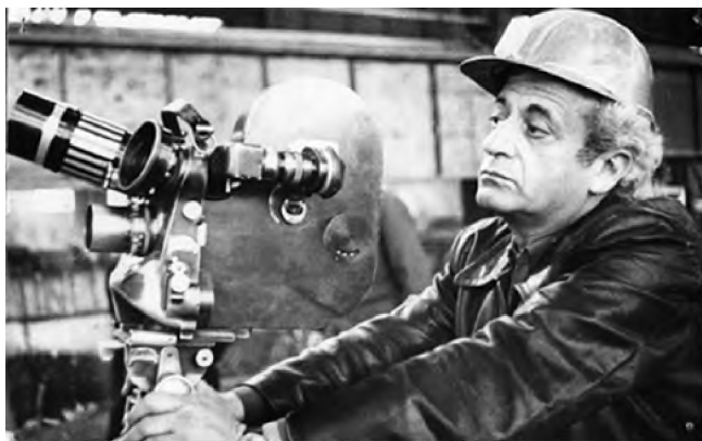
Кінооператор і режисер Ізраїль Гольдштейн у фільмі Віктора Олендера «Пасажири з минулого століття». Національна кінематека, 2001.

вали як родину ворога народу. Костя з його уже загартованим характером їхати з матір'ю відмовився. Він закінчує школу і вступає в Уманський сільгоспінститут. І там стається диво: в Умань приїдуть на гастролі актори провідного театру України, і Амвросій Бучма помітить хлопця, який вів студентський концерт і читав зі сцени Маяковського. Бучма наполягає, аби Костя приїхав вчитися на актора – він того року набрав курс. І дбав про сироту, як батько. На жаль, вчитель Степанкова не дожив до акторського тріумфу свого талановитого учня, але він відразу повірив у нього й ніколи тієї віри не втрачав. Ці маловідомі сторінки біографії Степанкова вражають найбільше.