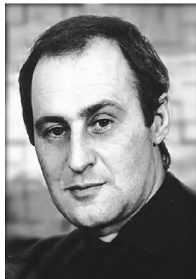
Кінорежисер Віктор Олендер.

ки української, про собаку і вовка. Це автентична штука! Так само, як Семен у шинку вкрав затички – чопики з бочок. Це анекдот ще епохи Відродження, європейський! Там кожна хвилинка – відсилка до історії. І воно працює. Це справжність. Я, як писав «Пекельну хоругву», стільки історичних документів перекопав!