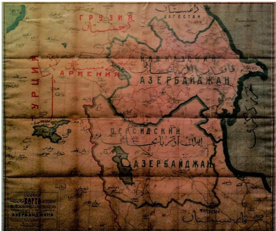
Карта Азербайджану, 1918 р., 147 тис. 629 км 2

Унаслідок проведення дашнакською владою політики «Вірменія без тюрків» кількість азербайджанського населення в Єриванській губернії (колишня територія Іреванського ханства Азербайджану) зменшилася з 375 тис. 1916 р. до 70 тис. 1922 р.