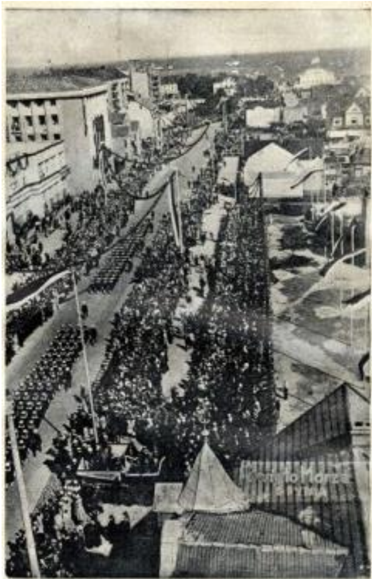
Święto Morza w Gdyni. Czoło defilady na ul. 10 latga.

Додаток 7: «Свято Моря», організоване Лігою Морською та Колоніальною в Гдині.