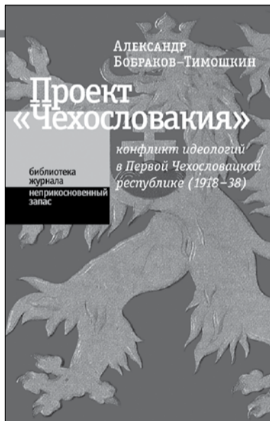
Александр Бобраков-Тимошкин Проект «Чехословакия» Конфликт идеологий в Первой Чехословацкой республике (1918–1938) Москва: Новое Литературное Обозрение, 2008

Наостанок треба зауважити, що діяльність основних акторів, які впливають на процеси впровадження політики гендерної рівності, здійснюється 1) на рівні інституцій політики і держави, де приймають політичні рішення – так звана дія «зверху»; 2) на рівні громадських ініціатив – представлених, передусім, жіночим рухом, так званою дією «знизу»; 3) на рівні інституцій освіти і науки; 4) на рівні міжнародного впливу – міжнародні організації, програми, проекти тощо; 5) на рівні інформування громадськості – медіа, які радше відіграють роль посередника між переліченими інституціями. І важливою є не лише робота кожного актора чи групи акторів, а налагоджені зв'язки (співпраця) між ними. Успішне впровадження та регулювання гендерних відносин передбачає утвердження цінності гендерної рівності як у суспільстві загалом, так і в різних його інституціях зокрема, недопущення дискримінації за ознакою статі, забезпечення рівної участі жінок і чоловіків у прийнятті суспільно важливих рішень (найперше на ринку праці та у сфері політики), забезпечення жінкам і чоловікам рівних можливостей для поєднання професійних і сімейних обов'язків. □