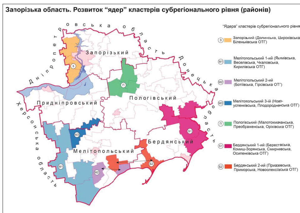
Рис.2. Розвиток «ядер» кластерів субрегіонального рівня

Другий кластер утворений Приазовською, Приморською та Новоолексіївською ОТГ. За своїми показниками він поступається першому, але незначно. На нашу думку, внаслідок синергетичних зв'язків можливим є підсилення фінансової спроможності ОТГ кластеру.