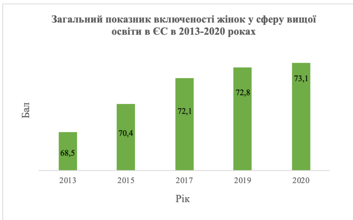
Рис. 1.1. Загальний показник включеності жінок у сферу вищої освіти в ЄС в 2013-2020 роках

гендерної рівності у сфері “Знання” розподіл за країнами, 2013-2020 роки”. Також відбулося падіння балів в порівнянні між 2013 і 2020 роками в домені Знання, найбільшими були падіння у Великій Британії, Німеччині та Данії. При аналізі включеності жінок у сферу вищої освіти, помітне поступове зростання показників (Рис. 1.1).