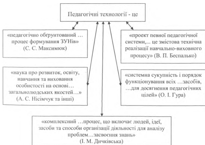
Рис. 3 Основні аспекти педагогічних технологій.

5. Проф. М. М. Фіцула вважає, що сьогодення ставить такі основні вимоги до сучасного фахівця як «високий рівень професіоналізму..., інноваційний характер та гнучкість мислення; навички управлінської діяльності;...високі духовні й моральні переконання; високу політичну, правову, економічну та психологічну культуру; володіння однією із...іноземних мов; знання комп'ютерної техніки тощо» [11, с. 44].