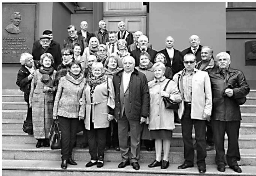
Зустріч у 2017 р. випускників філософського факультету КДУ ім. Т. Шевченка (випуск 1972 року)