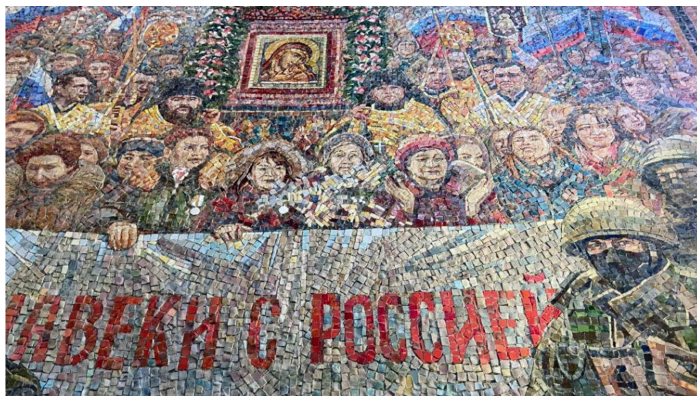
Рисунок 2. Збільшений фрагмент готової фрески «Воз'єднання Криму з Росією». 198