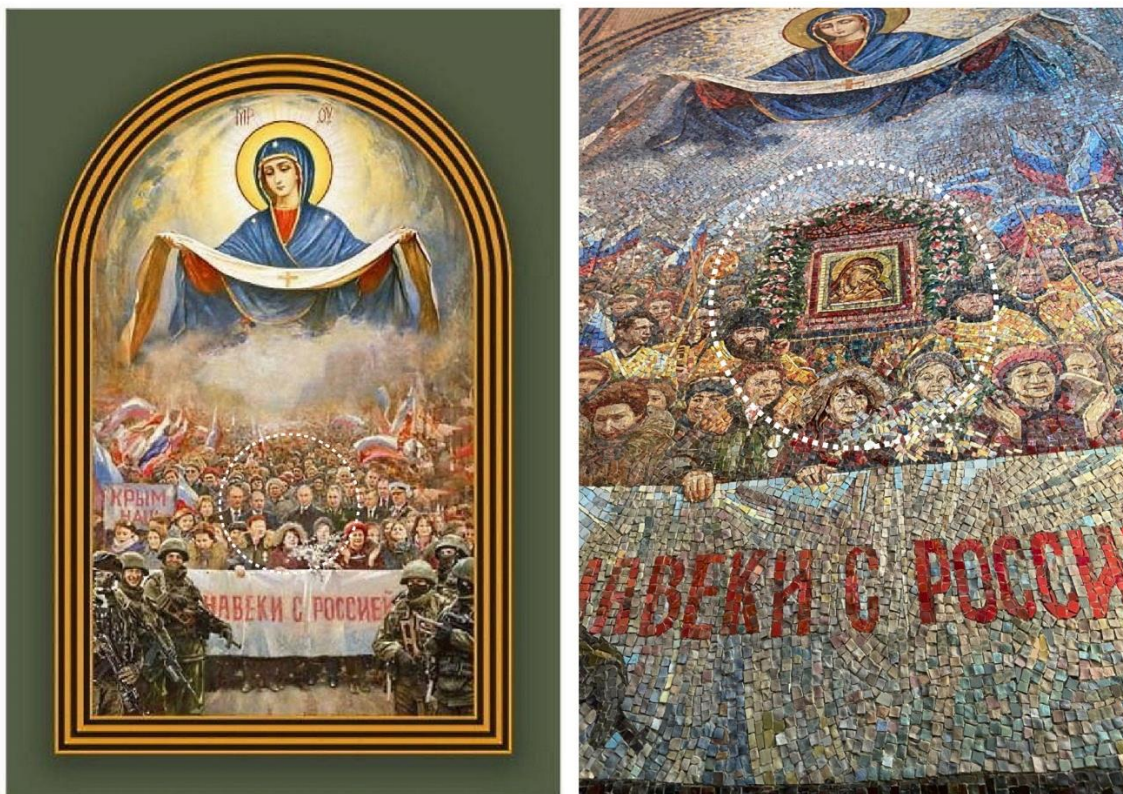
Рисунок 1. Зліва - проєкт фрески з В. Путіним та С. Шойгу. Справа — готова фреска, з зображенням Корсунської ікони Божої Матері, замість В Путіна і колег. 197