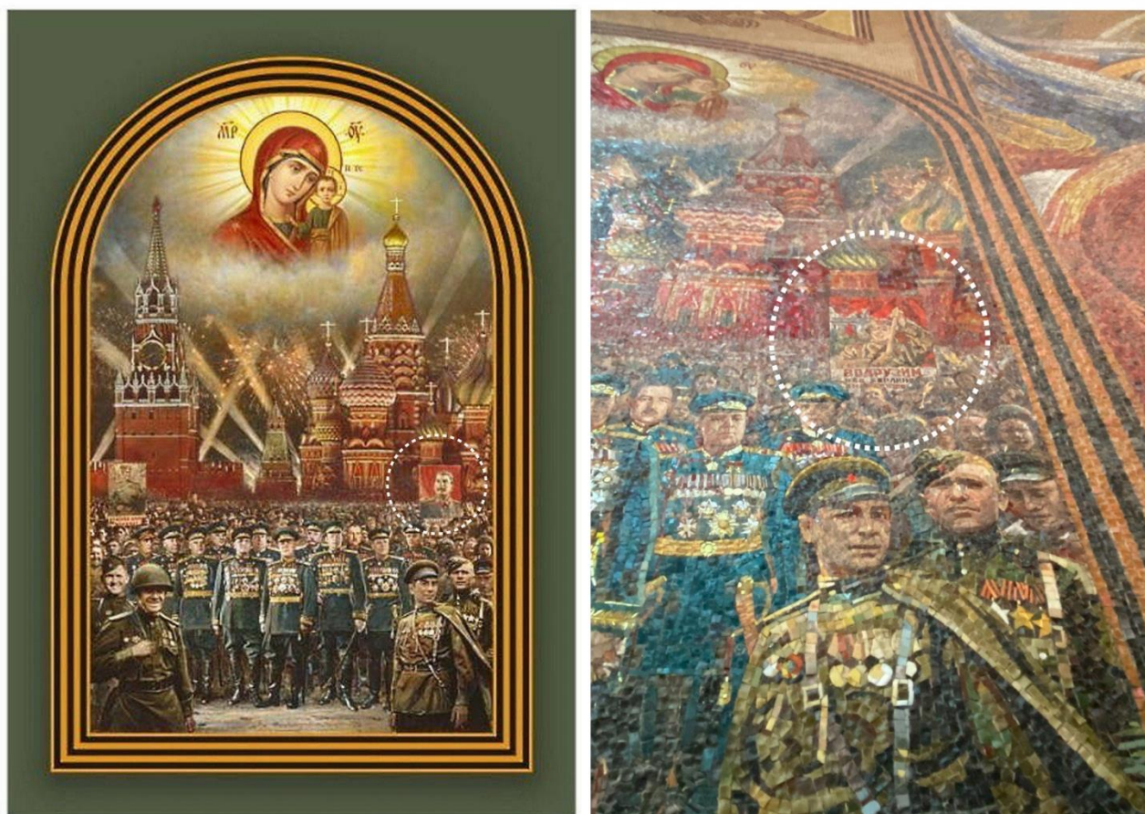
Рисунок 1. Зліва — проєкт панно з Й. Сталіним. Справа — готова фреска, на якій зображення Й. Сталіна замінили на плакат «Водрузим над Берлином знамя победы». 196