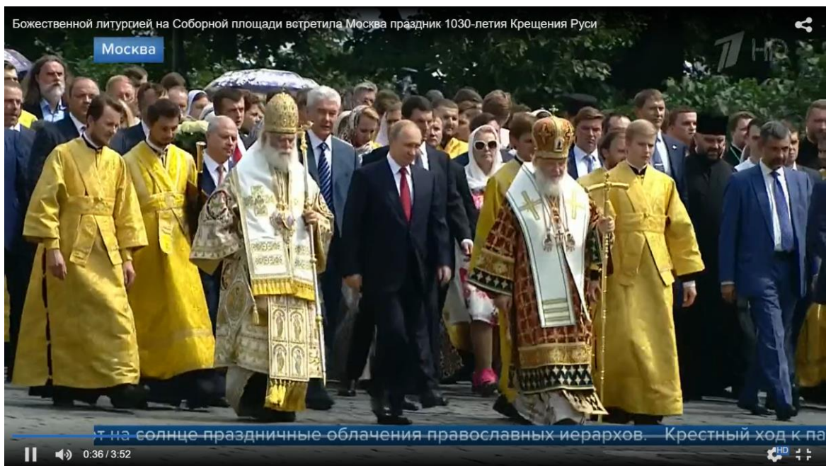
Рисунок 3.2.4. Патріарх Кирило та В. Путін очолюють хресну ходу до Дня Хрещення Русі 2018. Кадр з відеосюжету «Божественною літургією на Соборній площі зустріла Москва свято 1030-річчя Хрещення Русі» 190 «Первого канала».

Наступним фрагментом сюжету є уривок звернення В. Путіна, у якому він апелює до моральних опор (як синонім до духовних скреп) та дякує РПЦ за подвижницьке служіння і молитви за Росію, народ і співвітчизників за кордоном. Бачимо, що дискурс релігійного свята використовується, щоб артикулювати певну єдність Росії і її співвітчизників за кордоном. Єдність є одним з домінантних значень дискурсу навколо цього свята.