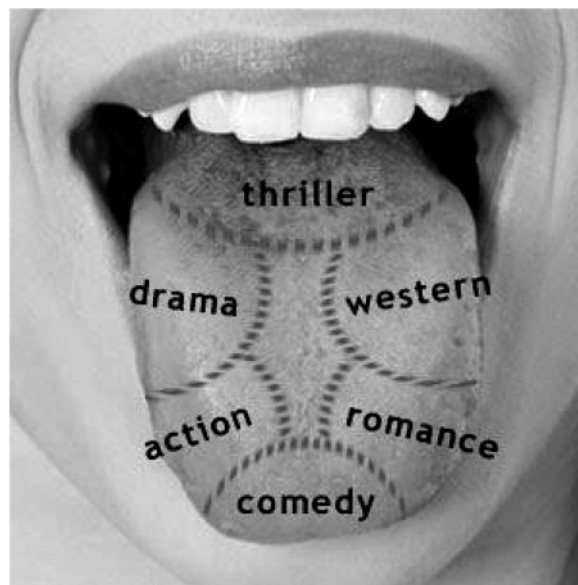
Рис. 2. «Смакова мапа» кіножанрів

Доречною в цьому контексті буде також ілюстрація «смакової мапи» сучасних кіножанрів (рис. 2), на якій продемонстровано суб'єктивні сенсорно-когнітивні асоціації.