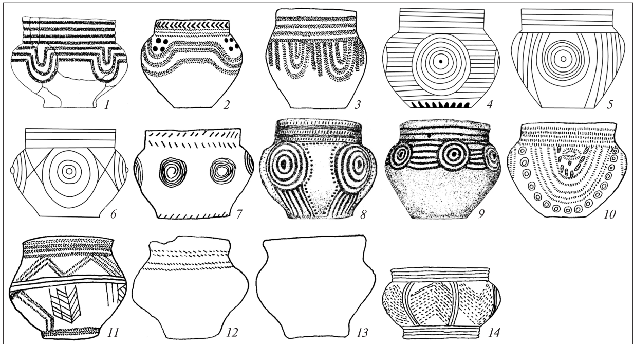
Рис. 1. 1 — Привільне 1/3; 2 — Лозуватка 20/11; 3 — Войково 2/18; 4 — Оріль-Самарське межиріччя; 5 — Кропоткіно 12; 6 — Оріль-Самарське межиріччя; 7 — Виноградне 3, насип; 8—9 — Семенівка 2/4; 10 — Василівка 1/4; 11—12 — ПівдГЗК 2/26; 13 — ПівнГЗК 2/7; 14 — Велика Білозерка 21/33

Fig. 1. 1 — Pryvilne 1/3; 2 — Lozuvatka 20/11; 3 — Voikovo 2/18; 4 — Oril-Samara basin; 5 — Kropotkino 12; 6 — Oril-Samara basin; 7 — Vynohradne 3, mound; 8—9 — Semenivka 2/4; 10 — Vasylivka 1/4; 11—12 — Southern Iron Ore Enrichment Works (PJSC Northern GOK) 2/26; 13 — Northern Iron Ore Enrichment Works (PJSC Northern GOK) 2/7; 14 — Velyka Bilozerka 21/33