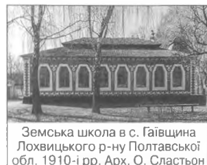
Земська школа в с. Гаївщина Лохвицького р-ну Полтавської обл. 1910-і рр. Арх. О. Сластьон

В. Коробцова (комерц. уч-ще, нині школа № 58, 1912), М. Шехоніна (прибутк. будинок Й. Юркевича на вул. Паньківська, № 8, 1910). На Сх. України свою школу нац. М. (т. зв. гуцул. сецесії) створили у Львові архітектори фірми І. Левинського, зокрема Л. Левинський, Ф. Левицький, О. Лушпинський, Т. Обмінський.