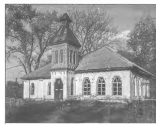
Земська школа в с. Макушиха Варв'язького р-ну Чернігівської обл. 1910-і рр. Арх. О. Сластьон

віл. банк (1914, арх. В. Городецький). Водночас із заг.-європ. версією ар нуво на Сх. України з'явився укр. архіт. М. Перша і краща його споруда – будинок Полтав. губерн. земства (нині краєзн. музей, 1903–08, арх. В. Кричевський), де використано нац. мотиви: шестикутні (трапец.) форми ніш, лоджій, вікон і дверей; багате кам'яне різьблення. Розписи, фризи й панно інтер'єрів, зокрема гол. залу, перекритого еліптич. склепінням, виконані художниками М. Самокишем і С. Васильківським. Ін. відомі споруди в стилі сх.-укр. М., створені харків'янами, – Харків. с.-г. селекц. станція (1909–11, арх. Є. Сердюк і З.-М. Харманський), Харків. художнє уч-ще (1909–12, нині один із корпусів академії дизайну й мист-в, арх. К. Жуков). Тут використано стилізацію нар. дерев'яної арх-ри та оздоблення керамікою. У Катеринославі 1912 збудовано прибутк. будинок В. Хреннікова (тепер готель «Україна», арх. П. Фетісов). Споруди укр.