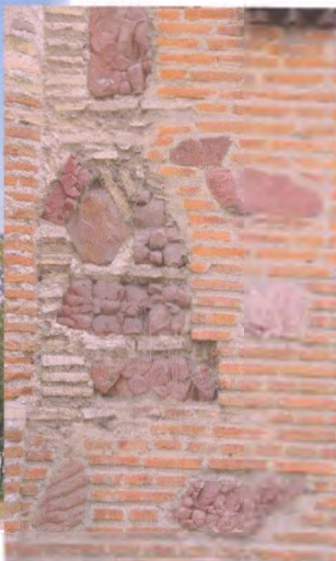
Рисунок 4. Церква Св. Василя у м. Овруч, у стінах спостерігаються шматки різнокольорового кварциту