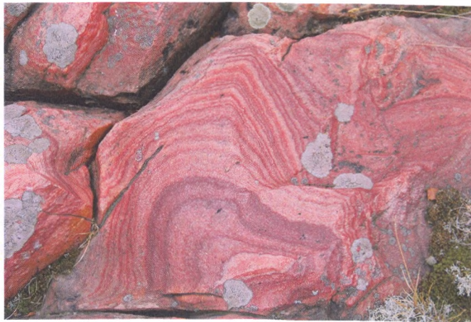
Рисунок 1. Різнокольоровий смугастий кварцит поблизу с. Листвин, Житомирська обл.