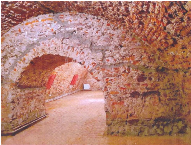
Рисунок 5. Підвалини церкви Святого Духа