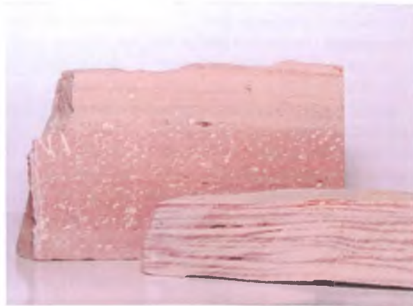
Рисунок 3. Пірофіліт, с. Збраньки, Житомирська обл.