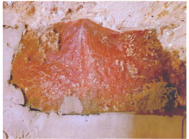
Рисунок 6. Кварцит у стінах підвалин церкви Святого Духа

Цікавим є факт, що трапезні почали з'являтися у складі монастирських архітектурних споруд саме з XII століття. У ті часи було заведено правило жити і харчуватися при монастирях, звідси і поварня з келіями [5]. Трапезна була зроблена з цегли з довгими склепіннями (апсидами). Одвірки зроблені з білого мармуру. Відомо, що для внутрішнього оздоблення церковних споруд застосовували привозний, вірогідно, італійський білий мармур, з якого виготовляли колони, сходи, капітелі, одвірки і багато іншого.