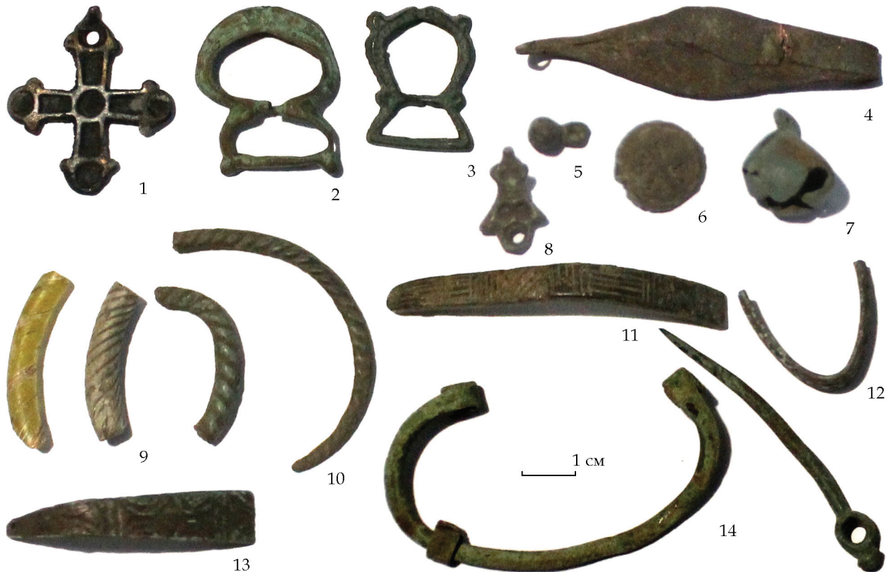
Рис. 2. Знахідки з культурного шару з в ур. Посадова Гора (літописне місто Треполь) у 2018 р.: 1–8, 10–13 – бронза; 9 – скло

Вивчення описаних вище нашарувань у шурфі 1 дає змогу зробити наступні висновки: