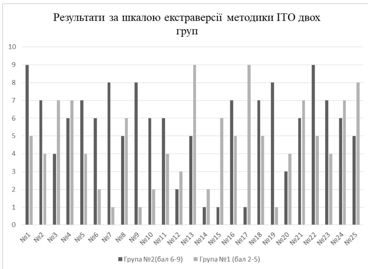
Рисунок 2.2. Результати за шкалою екстраверсії методики ІТО двох груп

Опитувальник «МИНИ-СМИЛ» (див. Додаток Д) - використовується для визначення суб'єктивної оцінки людиною свого стану. Складається з контрольних шкал: брехня, достовірність, корекція та базових шкал: надконтроль, песимістичність, емоційна лабільність, імпульсивність, жіночність, ригідність, тривожність, індивідуалістичність, оптимізм, інтроверсія. Методика була надана онлайн, результати зібрані так само.