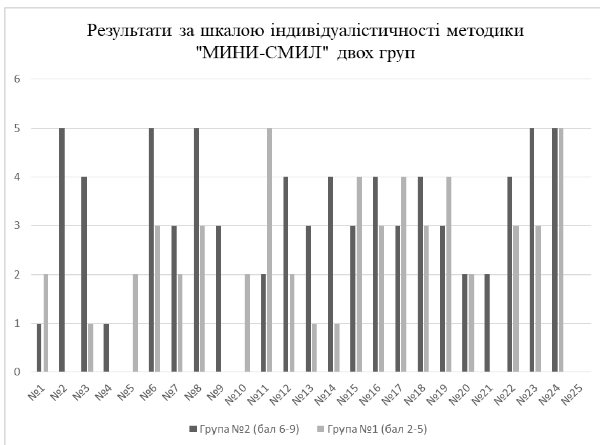
Рисунок 2.3. Результати за шкалою індивідуалістичності методики «МИНИ-СМИЛ» двох груп.

становить 0,29; кореляція шкали інтроверсії двох груп становить 0,1, обидва значення знаходяться в допустимих границях (-1; 1), що свідчить про наявність взаємозв'язку. Критерій Стюдента шкали індивідуалістичності дорівнює 1,48 і його показник є меншим за табличний, що говорить, що коефіцієнт кореляції – не значимий. Розрахунки в онлайн калькуляторі – див. додаток . Критерій Стюдента шкали інтроверсії дорівнює 0,7 і його показник є меншим за табличний, що говорить, що коефіцієнт кореляції – не значимий.