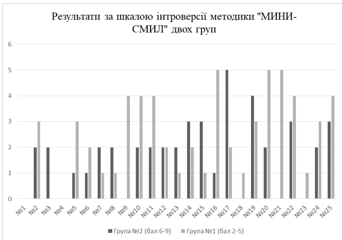
Рисунок 2.4. Результати за шкалою інтроверсії методики «МИНИ-СМИЛ» двох груп.