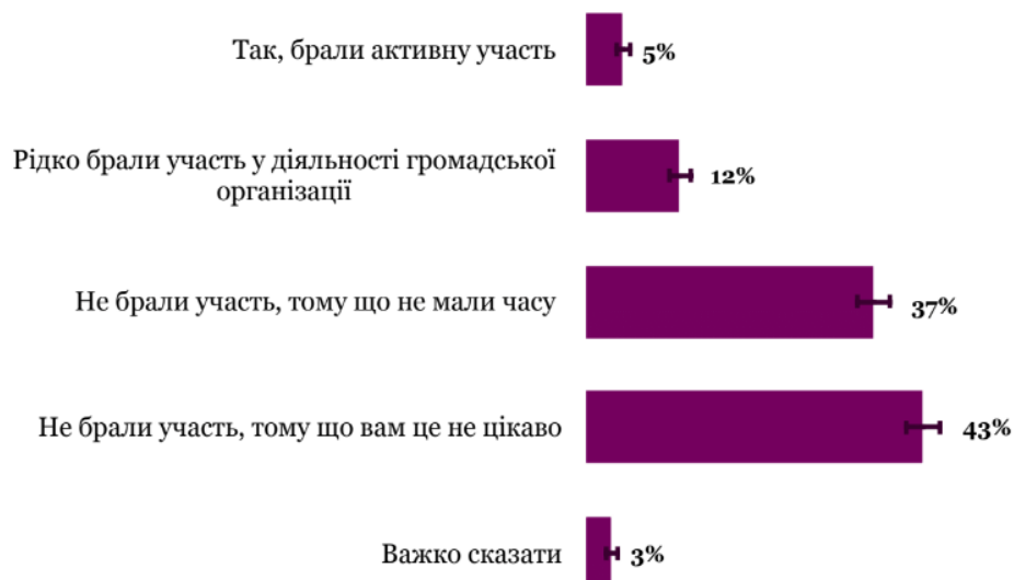
Рис. 1.1. Опитування громадської думки для оцінки змін обізнаності громадян щодо громадських організацій та їхньої діяльності (За звітом Програми «Долучайся!»)