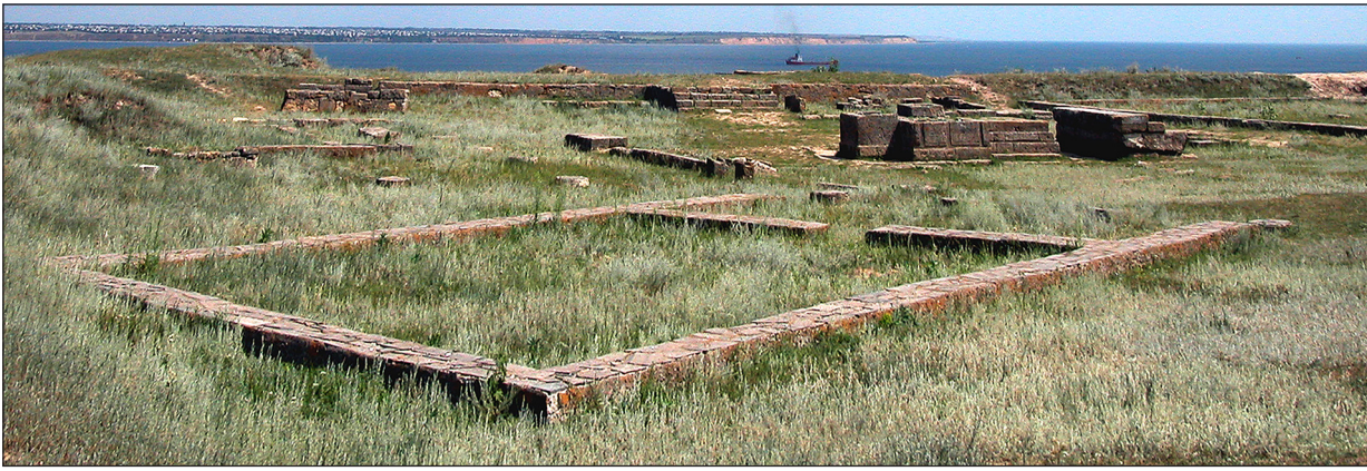
Рис. 8. Консерваційний макет над храмом Зевса на Східному теменосі. Fig. 8. Conservation model over the temple of Zeus on the Eastern Temenos.

звело до утворення місцями 5—8-метрових культурних нашарувань та наявністю як материка лесового ґрунту. Перші поселенці одразу отримали змогу використовувати переваги останнього, заглиблюючи свої житла та інші споруди у землю (Крыжицкий 1985, с. 58 сл.), а в подальшому активно використовувати в будівництві потужні поклади лесових глин у вигляді сирцевої цегли або шарових підвалин з використанням золи (Крыжицкий, 1985, с. 89 сл.; 1993, с. 172, рис. 47). Комбінація цих глин з кам'яними конструкціями й створили специфічні умови для сучасних досліджень і подальшого збереження пам'ятки.