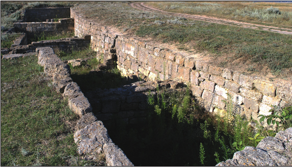
Рис. 4. Загальний вигляд з півдня на підвали будинків Центрального кварталу, що примикають до Головної вулиці.

Fig. 4. General view from the south on the basements of the Central Quarter buildings, adjacent to the Main Street.