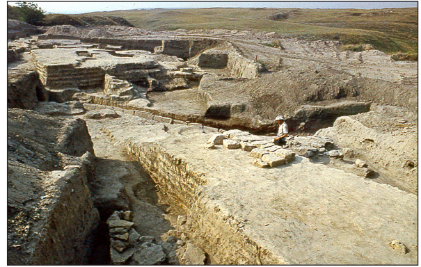
Рис. 7. Загальний вигляд з півночі на шарові підвалини оборонного муру та південної башти комплексу Західних воріт.

На підставі наукових звітів про розкопки та інформації про додаткові дослідження і виходячи з принципів анастилоза, розробляються детальні пропозиції стосовно консерва-