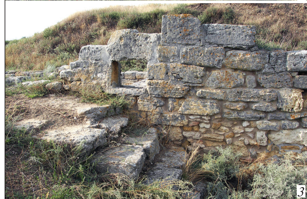
Рис. 2. Східна стіна підвалу житлового будинку на ділянці А до реставрації (1), фото С. Д. Крижицького, та після реставрації (2), фото А. В. Буйських, сходи до підвалу житлового будинку А-2 (3), фото А. В. Буйських