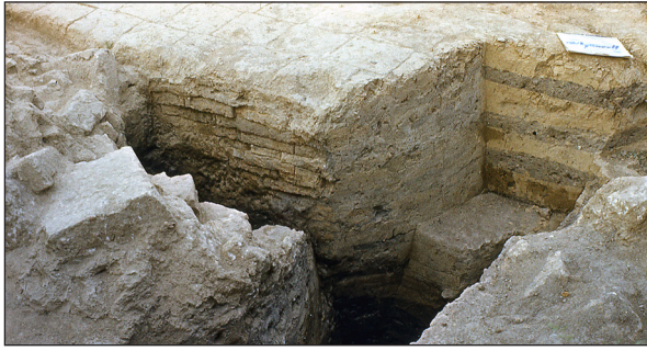
Рис. 6. Північна башта із сирцевої цегли та шарові підвалини західного оборонного муру комплексу Західних воріт.

Fig. 6. North tower made of raw bricks and layered foundations of the western defensive wall of the Western Gate complex.