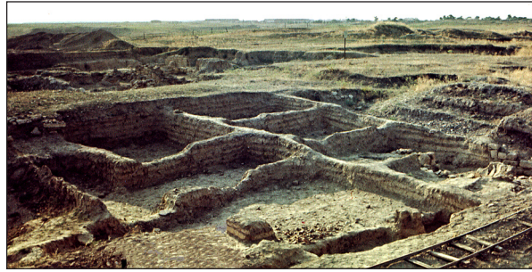
Рис. 5. Шарові підвалини будинку на Центральному кварталі.

Fig. 5. Layered foundations of the house in the Central Quarter.