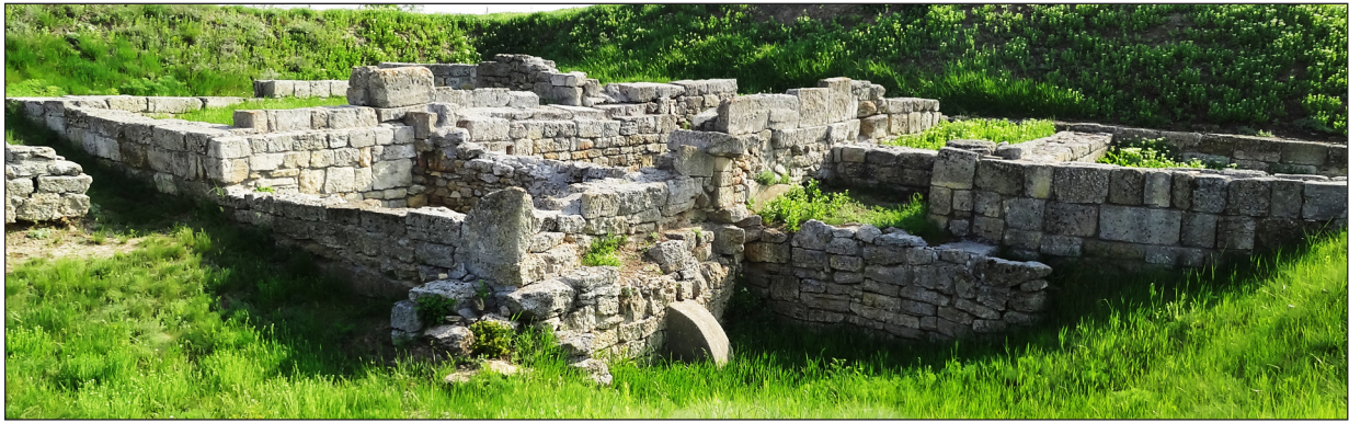
Рис. 3. Загальний вигляд будинків на ділянці А з південного сходу. Fig. 3. General view of houses at section A from the south-east.

кавий будівельний прийом, який винайшли ольвійські будівельники у другій половині IV ст. до н. е. з огляду на брак природного каменю (Крыжицкий 1971, с. 112, рис. 53–54). На жаль, натурний стан таких споруд, зафіксований під час розкопок (рис. 5; 6; 7), зберегти для експонування ще й досі не вдається. Тому для експонування основних монументальних споруд міста, таких як храми на Східному теменосі, на початку 1980-х рр. було застосовано метод імітації планувальної структури у вигляді виконаних у натуральний розмір макетів із сучасних матеріалів (рис. 8). Застосування саме такого способу експонування передбачає, за умови винайдення кращого, швидко заміну цих макетів. У процесі пошуку прийнятних методів консервації задля збереження в натурі плану споруди було запропоновано ще один — засипку вибраних фундаментів відпрацьованими керамічними черепками. Таким чином зараз підтримується експозиційний вигляд залишків храму Аполлона Лікаря на Західному теменосі (рис. 9). Натомість, монументальні вівтарі на Східному та Західному теменосах зберігаються у законсервованому стані з використанням в'язучого розчину. Їх стан зараз практично незмінний від моменту відкриття (рис. 10: 1–2). Цей цикл робіт було проведено під керівництвом А. І. Кудренка та О. С. Біляєва (див. про це детальніше: Біляєв, Кудренко 1994, 103 сл.).