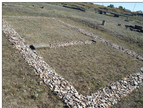
Рис. 9. Консерваційний засип керамікою фундаментних траншей храму Аполлона Лікаря на Західному теменосі. Фото А. В. Буйських

історія археологічних досліджень; основні публікації архітектурно-будівельних залишків та їх загальні плани; висновок про те, які споруди або їх частини були вибрані як найбільш пріоритетних для експонування; інформація про попередні реабілітаційні заходи; натурні обміри автентичних будівельних залишків; рекомендації щодо подальшої музеєфікації об'єкта експонування. Вулиці, деталі благоустрою (кам'яні вимостки, водогони відкритого та закритого типів, цистерни, колодязі) та основні споруди — культові будівлі (вівтарі та храми, міські святилища), житлові будинки, стіни і башти захисних споруд тощо. Кожен об'єкт і його складові (будинки, окремі приміщення, підвали, кам'яні мури, сходи, дверні отвори, перекриття) фотографуються з однієї або кількох позицій, описуються, наводяться їх натур-