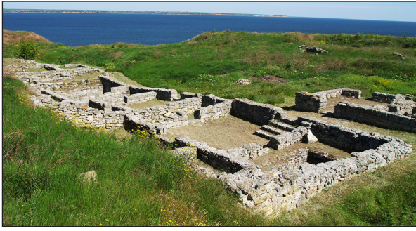
Рис. 1. Ділянка І (И). Сучасний вигляд з південного заходу.