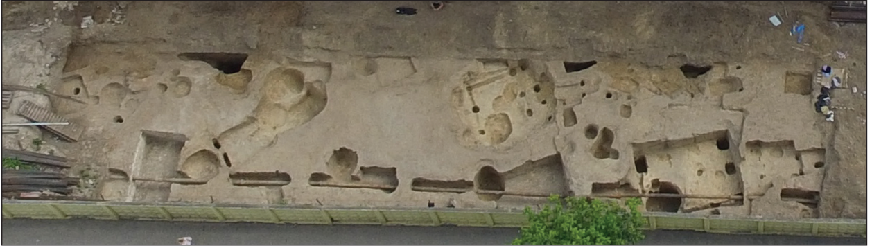
Рис. 1. Загальний вигляд розкопу. Зйомка з квадрокоптера DJI Phantom 3 Vision