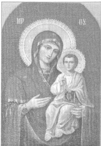
Густинська чудотворна ікона Божої Матері

З 1793 р. в історії Густинського монастиря починається півстолітня чорна смуга. За Катерини II він був закритий, а час завдав обителі тяжких ран. Нове відродження стало можливим тільки в 40-і роки XIX ст. Архієпископ Полтавський Гедеон звернувся до пастви із закликом повернути монастирю життя. Потрібні кошти було зібрано, Святійший Синод видав указ про відновлення й відкриття Густинського монастиря, і 15 травня 1844 р., в день Святої Трійці, відбулися урочистості. Серед тих, хто приїхав того дня до Густині, був, напевно, й князь Микола Григорович Репнін, колишній генерал-губернатор Малоросії, який мешкав у своєму маєтку в Яготині. Густинь відновлювалася за його фінансового сприяння - князь знав, що людина залишає по собі пам'ять добрими спра-