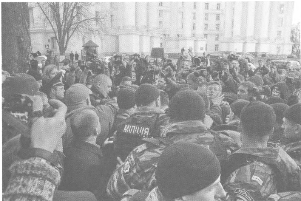
Акція протесту проти нищення Андріївського узвозу біля офісу компанії «ЕСТА-холдинг», 11 квітня 2012.