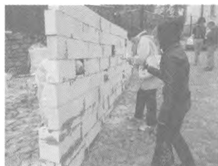
Перформанс в рамках фестивалю

В рамках Міжнародного архітектурного фестивалю «CAN-actions 2011» у київському Будинку архітектора відбувся круглий стіл « Андріївський узвіз: концепція реставрації забудови і благоустрою території », в рамках якого концепція була представлена архітектурній громадськості.