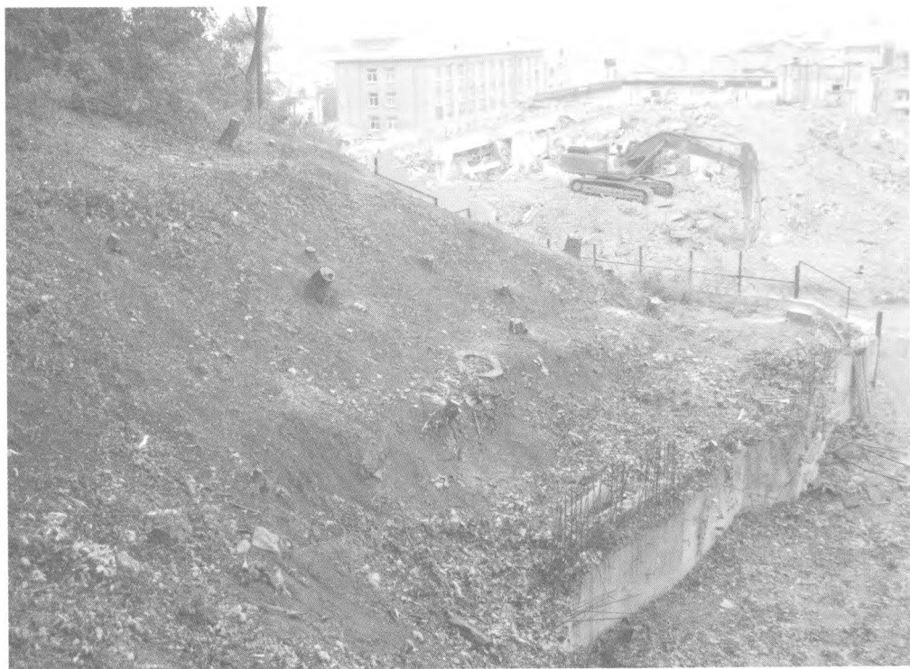
Схил Замкової гори. Екскаватор стоїть на території колишньої фабрики «Юність»