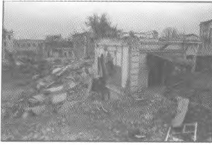
Зруйновані будинки колишньої фабрики «Юність».