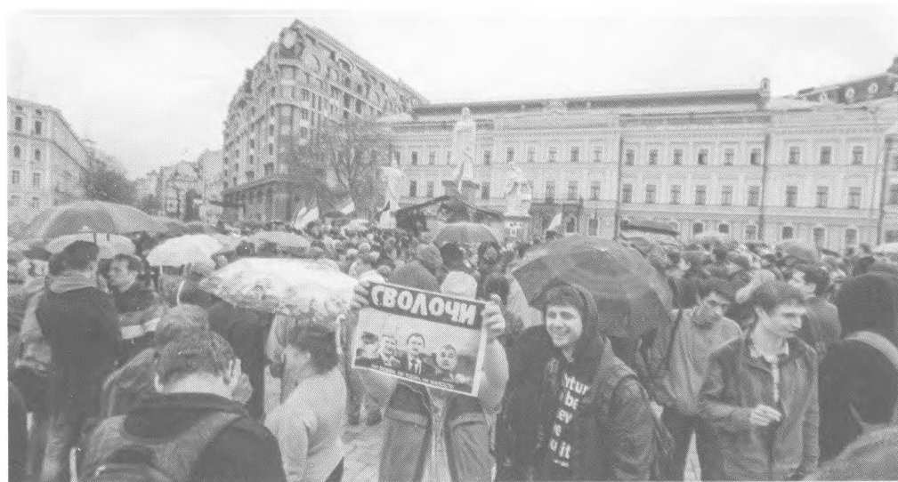
Громадська акція «Захистимо Андріївський узвіз — захистимо Україну». Михайлівська площа — Хрещатик, 21 квітня 2012.