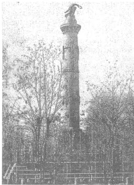
Полтава, пам'ятник слави (листівка початку XX ст.)

безладне господарювання, недостатню турботу про збільшення міських статків. Адміністративне керівництво призводило до прийому думами незавершених будов, споруджених із порушенням технологій. Більше того, адміністрація розпоряджалася коштами дум і спрямовувала їх на різні виплати, а саме на ті справи, якими опікувалися державні установи не лише Полтавської губернії, а й Чернігівської. Серед багатьох інших — колона-монумент, присвячена Полтавській битві.