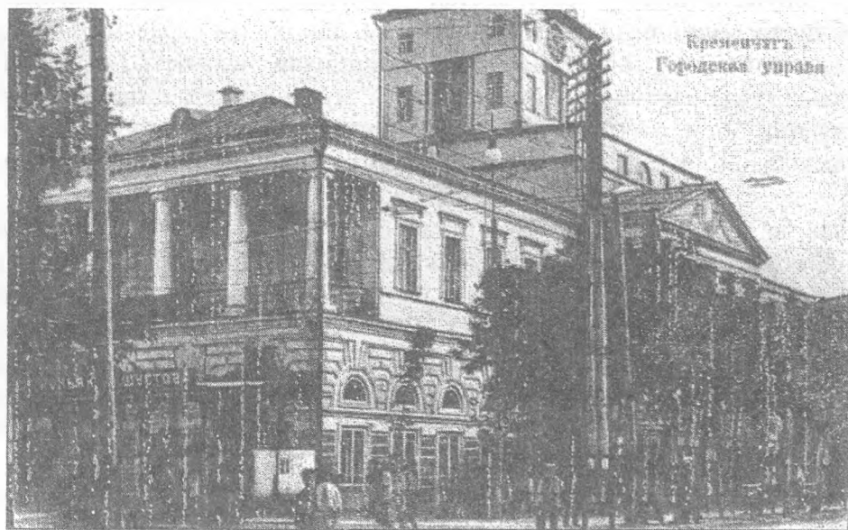
Кременчук, міська управа (листівка початку XX ст.)

робили його попередники, котрі самі суттєво збагачувалися від ярмаркових статків і щедро віддячували губернатора і генерал-губернатора 53 . У Полтаві, яка стала з 1802 р. центром Малоросійського генерал-губернаторства, регіональна влада немало працювала над її благоустроєм, розуміючи, що саме він гарантуватиме прив'язку краю до імперії. Найбільше це їй вдавалося у спорудженні будівель адміністративних установ і навчальних закладів, де мали навчатися діти місцевого дворянства, зокрема кадетського корпусу й інституту шляхетних панянок, велична архітектура яких наочно переконувала у могутності влади Романових.