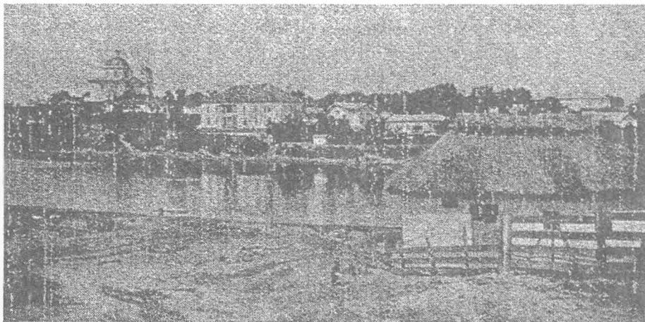
Біла Церква, загальний вид (ілюстрація до путівника 1898 р.)

Миколи I від 23 грудня 1834 р. порядок управління містом змінився: господарськими справами віднині займалася відновлена дума, котра припинила свою діяльність 1805 р., а магістрат, як і всі інші в Російській імперії – судовими справами 90 . Кам'янець зберігав магдебургію до 1809 р., коли з його підпорядкування було вилучено міське господарство з міськими статками і передано державній комісії, яка 1837 р. віддала їх думі.