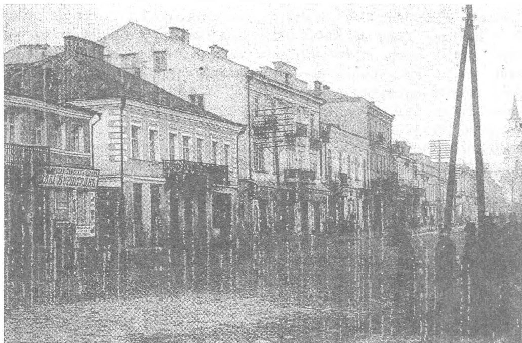
Бердичів, Махновська вулиця (фото початку XX ст.)

1845 р. повітовим містом став Бердичів, до якого перебралися присутствені місця з власницького містечка Махнівки, у якому залишалася лише державна пошта 109 . Бердичівській думі та магістрату з сирітським та словесним судом відтепер підпорядковувалися купці («люди торгового сословия») з інших містечок повіту. Оскільки Бердичів був приватним, то власникам заборонялося вдаватися до будь-яких інновацій, не узгодивши їх з урядом. Довести до кінця розпочату О.Д. Гурьевим реформу міського управління взявся волинський губернатор генерал-майор І.В. Каменський, який уважав за необхідне запровадити у всіх містах думи й ліквідувати магістрати, бо ті стали «бесполезным и вредным присутственным местом», із переданням їхніх повноважень повітовим судам 110 . Проте завершив її кн. І.І. Васильчиков, який зосередився на містах Київської губернії, намагаючись бути в тонусі ліберальних реформ Олександра II. Свої міркування він виклав у доповідній записці й отримав цілковите схвалення. Ба більше, йому Олександр II дозволив на власний розсуд з'єднати магістрати з повітовими судами. Вже на 1 липня 1860 р. дев'ять міських