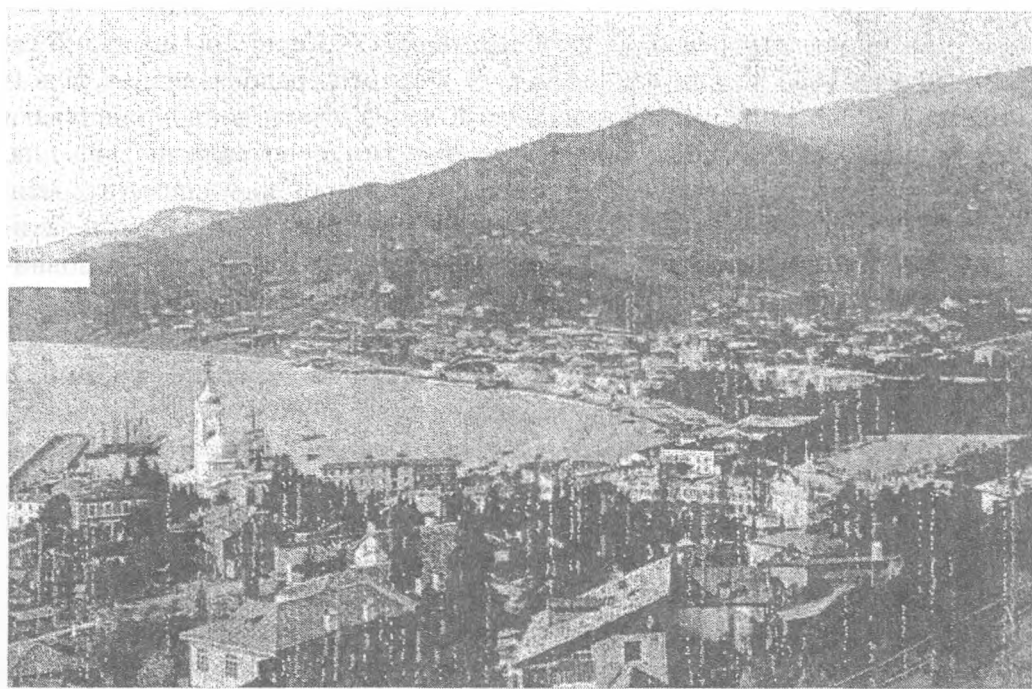
Ялта, загальний вигляд (ілюстрація до путівника 1902 р.)

замінити новий адміністративний центр Сімферополь. Старокримська ратуша відкрилася 1797 р., однак саме місто, яке називалося Левкополь, не могло підхопити сподівання центру, бо функціонувало лише для обслуговування ханської резиденції. У 1830-х роках у Керч почали інтенсивно переселятися російські купці та міщани, наближаючись за числом до половини місцевих міщан-греків. Це спонукало Державну раду дозволити і тим і тим обирати з-поміж себе по одному представникові до магістрату, ратуші і думи 159 . Для порозуміння й стабільності встановлювався порядок почергового обіймання посади міського голови у найбільших містах – Євпаторії, Сімферополі, Феодосії та Перекопі. Одну трирічну каденцію думи очолював голова християнського віросповідання, на наступну – обирався магометанин чи то караїм, чи кримський татарин. Якщо міська громада довірила б владу попередньому голові, то це право вважалося законним 160 .