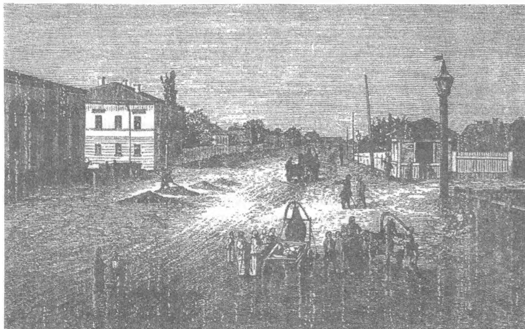
Чугуїв, загальний вигляд (ілюстрація з альбому 1886 р.)

польська ратуші отримали дозвіл видавати свідоцтва на торгівлю та білети на тримання торговельних закладів 26 .