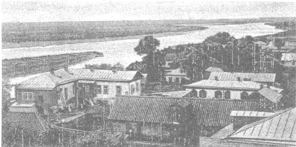
Чернігів, вид на місто та р.Десну (листівка початку XX ст.)

У разі відсутності міського органу його повноваження, як правило, виконувала поліція. Розмежувати повноваження між магістратом і думою не вдалося, бо тогочасна малоросійська спільнота не мала жорстких станових перегородок 44 . Чернігівська вже 1785 р. отримала від казенної палати у своє розпорядження оброчні статті, які приносили місту суттєві статки. Вона здавала на відкуп паромне перевезення через Десну, сіно-коси, винну торгівлю, лавки та комори.