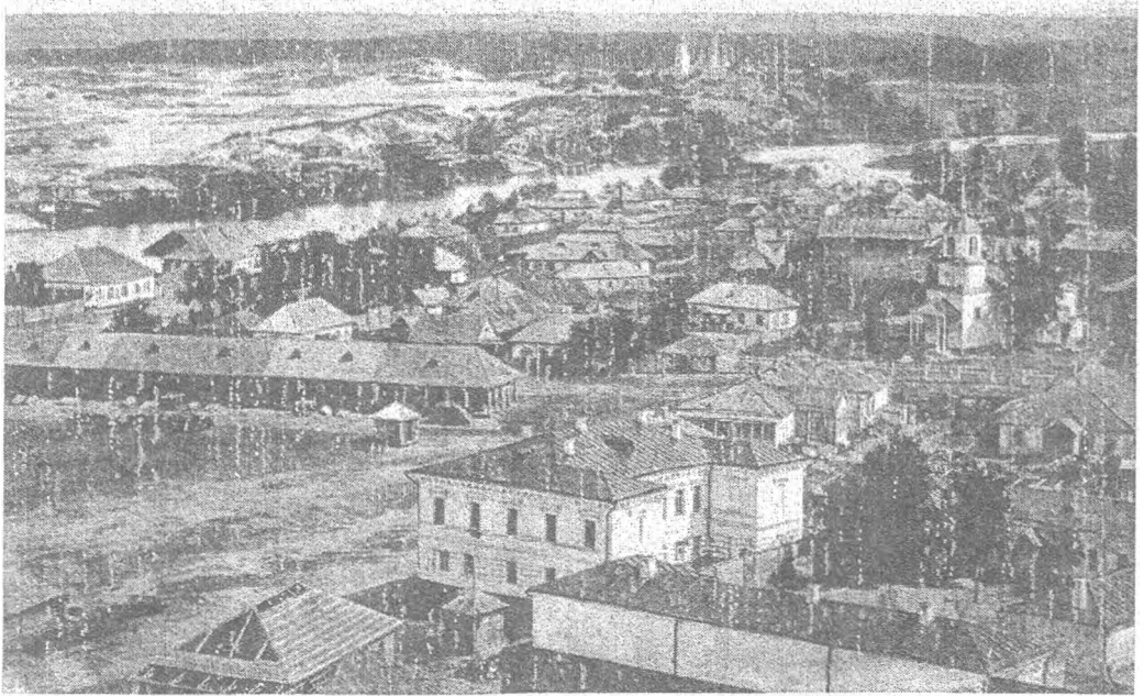
Чигирин, загальний вигляд (ілюстрація путівника 1902 р.)

і запровадити у них громадське управління. Таких у краї налічувалося 18. До них було віднесено і два міста, Ржищів із важливою пристанню на Дніпрі і Волочиськ, на Жмеринській залізниці. Незалежно від них нове міське положення слід було поширити і на п'ять заштатних міст Подільської губернії, які вже були містами у Речі Посполитій, а саме: Хмільник, Сальниця, Бар, Стара Ушиця і Вербовець, котрі за числом мешканців переважали містечкову норму, мали власні землі і доходи. У них вже діяли міські органи і установи – ратуші, сирітські суди, квартирні комісії – котрі займалися господарством і громадськими справами. До цих критеріїв він ще додав і переважання російського населення 19 . Решту містечок варто віднести до категорії сіл і «деревень», в залежності від наявності храму і не вживати до них назви «містечко» 20 . І все ж, час запровадження положення 1870 р. у тих чи інших містах, а воно має бути поступовим, визначав генерал-губернатор 21 .