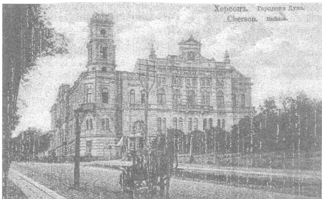
Херсон. міська дума (листівка початку XX ст.)

Серед містечок Київської губернії у статусі приватного найдовше перебувала Біла Церква, яка належала Марії Браницькій. Власниця лише 1908 р. розпочала клопотання про запровадження у м-ку органів громадського управління. За погодженням із генерал-губернатором переглядалося питання про припинення чиншових і орендних відносин між мешканцями і графінею. Власниця зобов'язалась передати місту вигін, ярмаркову площу в 25 дес., території усіх вулиць та землі, що перебували у спільному володінні з правом чиншовикам їх викупити. Умови неодноразово уточнялися, що затримувало остаточне рішення, а тому місто так і не здобуло права на власні органи влади 44 .