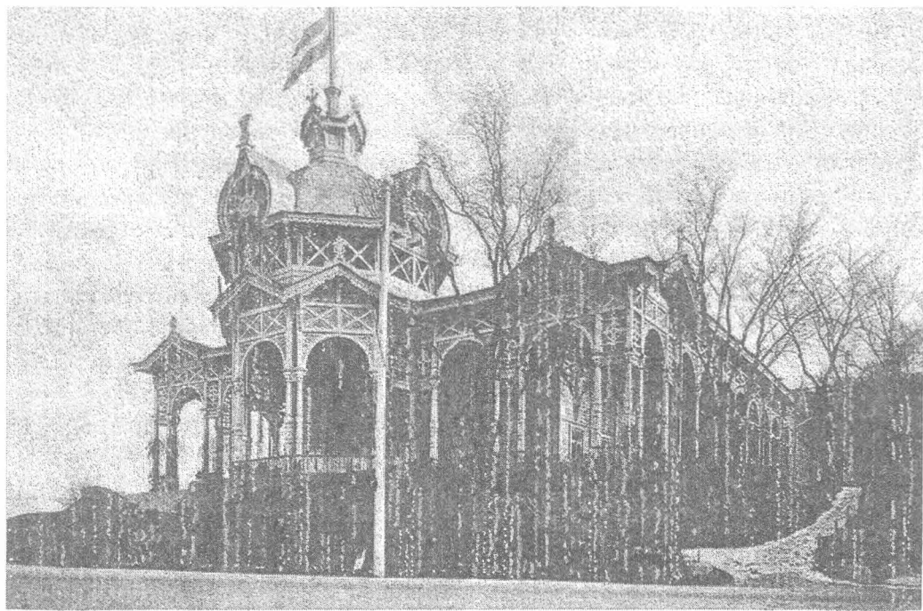
Київ. літнє приміщення купецького зібрання