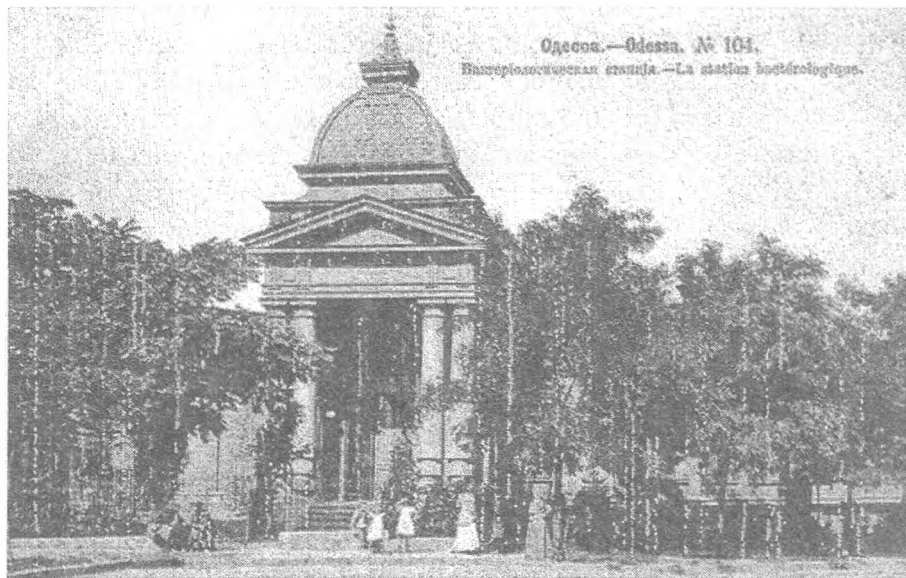
Одеса, бактеріологічна станція (лістівка початку XX ст.)

проти поширення сифілісу. Його діяльність, як і в столицях та Варшаві, була тісно підпорядкована думі 86 . Поїздка до Парижу 1873 р. професора-епідеміолога В.А. Суботіна для участі у міжнародному медичному конгресі принесла результат. Очолована ним кафедра гігієни в університеті св. Володимира почала готувати кадри лікарів і для міста. Ним була запропонована система санітарного нагляду: місто ділилося на ділянки, призначалися лікарі та урядники, які керували усією санітарною роботою та контролювали санацію міста 87 . 1875 р. було збудовано Олександрівську лікарню. Час від часу дума вдосконалювала організацію медичного нагляду. Уже в 1883 р. засновується Київське санітарно-статистичне бюро, а 1891 р. – міська санітарна станція та хіміко-бактеріологічний кабінет. Незабаром міські санітарні організації створюються у Херсоні (1878), Житомирі (1881), Полтаві (1883), Катеринославі (1884), Миколаєві (1885), Ялті і Чернігові (1886), Сімферополі (1890), Одесі (1892). Центральний статистичний комітет на початку XX ст. відзначив наявність оздоровчих закладів у багатьох містах, а у деяких з них по кілька, зокрема 11 – в Херсоні, 9 – в Чернігові, 4 – в Бердичеві, по 3 – в Мелітополі і Феодосії, 2 – в Миколаєві, Умані, по 1 – Ялті, Севастополі, Сумах, Полтаві, Кременчуку, Новгород-Сіверському 88 .