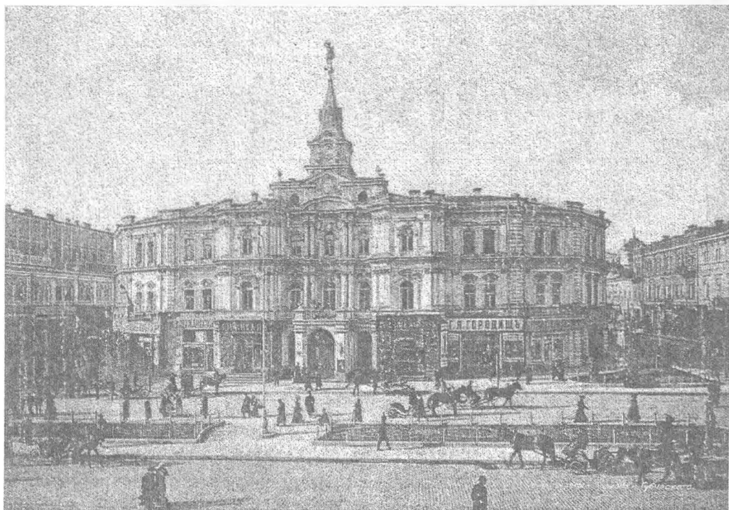
Київ, міська дума (1912 р.)

були вибори, оскільки саме вони створювали команду міських управлінців, яким держава доручала господарювати у місті. Будь-які порушення на виборах з'ясовувало губернське у міських справах присутствіє. Аби головами ставали здатні вирішувати проблеми міста особи, їх схвалював на посаді губернатор. Від перших 1871 р. і до останньої каденції всі вибори так чи інакше відбувалися з порушенням процедур, хоча з кожним наступним чотириріччям відхилень ставало все менше.