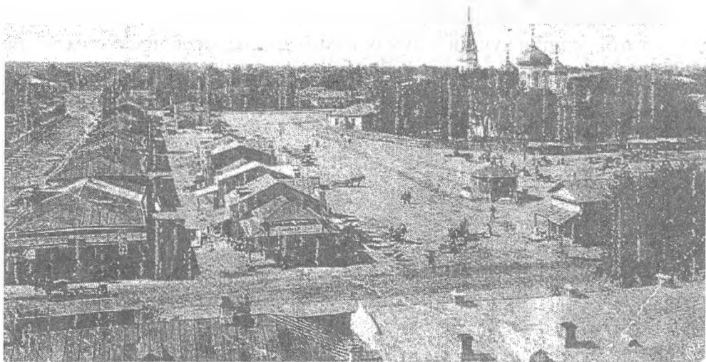
Черкаси, Соборна площа (листівка початку XX ст.)