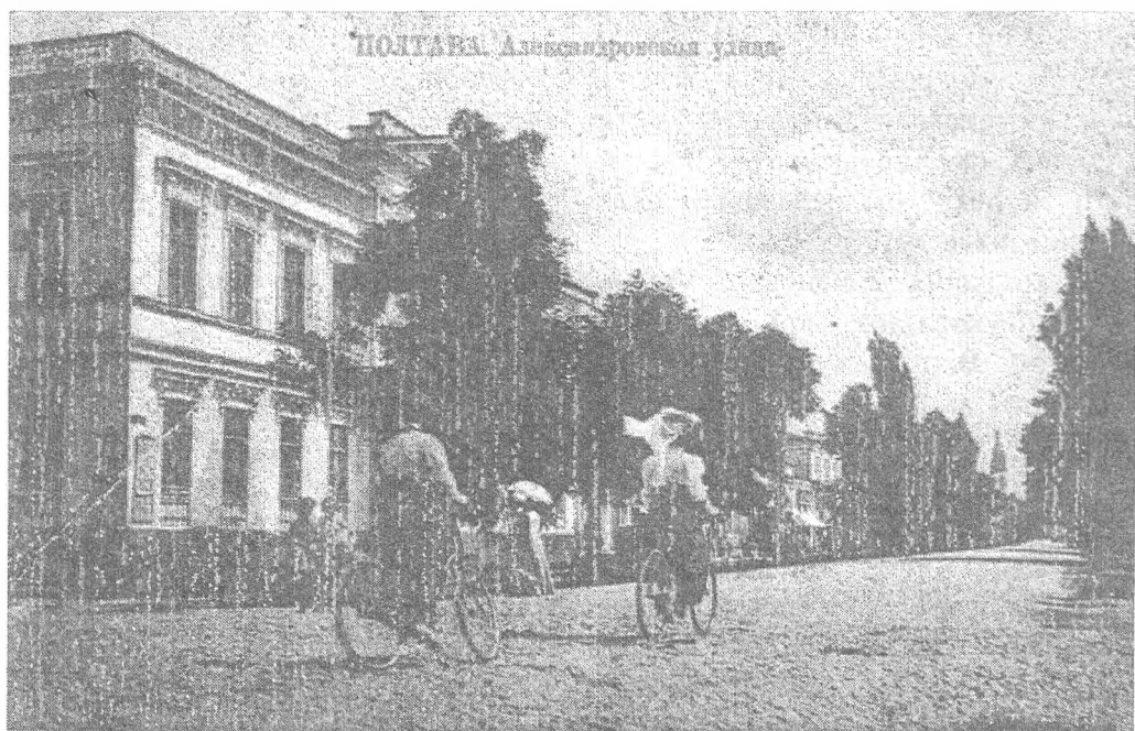
Полтава, Олександрівська вулиця (на передньому плані будівля колишньої ремісничої управи, листівка початку ХХ ст.)