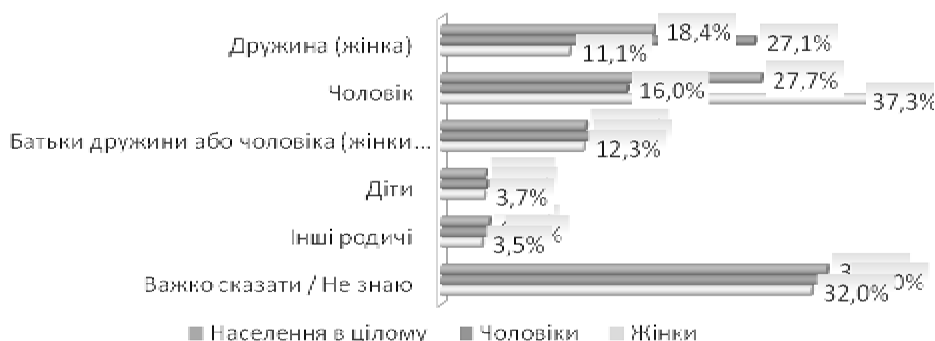
Рисунок 2. Розподіл респондентів за відповідями на питання стосовно ініціаторів насильства в сім'ї

Запитання стосовно ініціаторів насильства в сім'ї – це одне з небагатьох запитань, де найбільш поширена відповідь – "важко сказати" (ймовірно, через те, що ці респонденти вважають, що у їхніх родинах насильства в сім'ї немає) – 33%. Виокремлюються три основні типи провокаторів насильства в сім'ї: чоловік (28%), дружина (18%) і батьки дружини або чоловіка (13%). Діти та інші родичі значно рідше бувають провокаторами. Характерно, що жінки частіше за чоловіків вважають провокаторами саме чоловіків (37% проти 16% відповідно), а чоловіки частіше за жінок – саме дружин (27% проти 11% відповідно) (див. рис. 2).