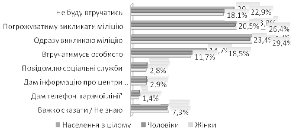
Рисунок 3. Розподіл респондентів за відповідями на питання, що вони робитимуть, коли в родині сусіда відбуватиметься насильство

В уявленнях мешканців Криму найбільш виправдана реакція на насильство у родині сусіда – звернення до міліції: 24% стверджують, що погрожуватимуть викликати міліцію, а 27% стверджують, що викличуть міліцію одразу. Неформальний соціальний контроль у вигляді особистого втручання виглядає малопоширеним – до нього готові тільки 15%, та й то на словах. Про брак соціальної згуртованості або поширеність соціальної байдужості свідчить і те, що 20% взагалі не втручатимуться. Однак чоловіки й жінки зорієнтовані реагувати по-різному: якщо жінки більше, ніж чоловіки, схильні звертатись до формальних інституцій соціального контролю – погрожувати або одразу викликати, то чоловіки більше за жінок схиляються до протилежних тактик поведінки – не втручатись або втручатись особисто (див. рис. 3).