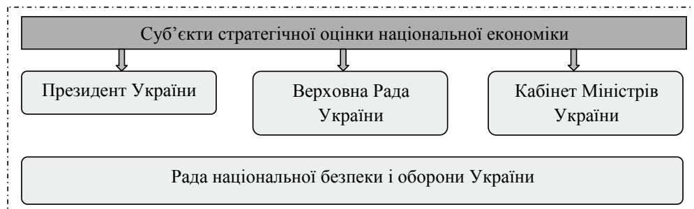
Рис. 1. Суб’єкти стратегічної оцінки національної економіки

Суб’єкти стратегічної оцінки національної економіки в умовах глобалізації представлено на рис. 1.