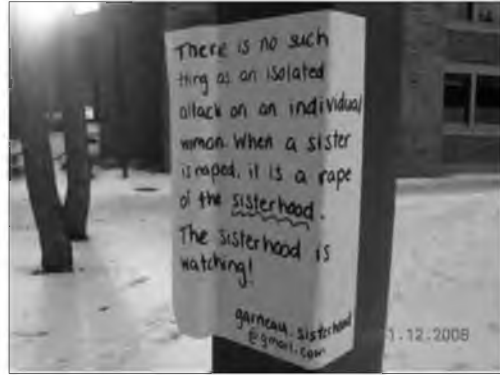
9.2. Рукописне оголошення в кампусі Університету Альберти: “Не буває окремої атаки на окрему жінку. Коли гвалтують одну із нас – гвалтують усіх жінок. Сестринство пильнує!”, м. Едмонтон, Канада, 2008 рік

У державах із розвинутою правовою культурою темі згвалтувань приділено багато уваги. Наприклад, у західноєв-