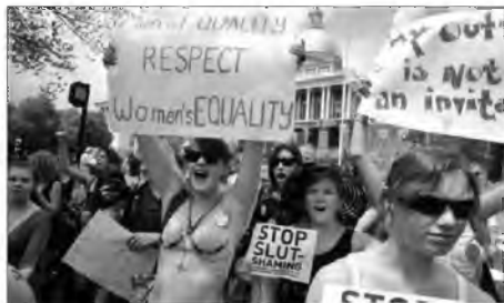
Достойні чоловіки поважають жіночу рівність. Мій вигляд — не запрошення.