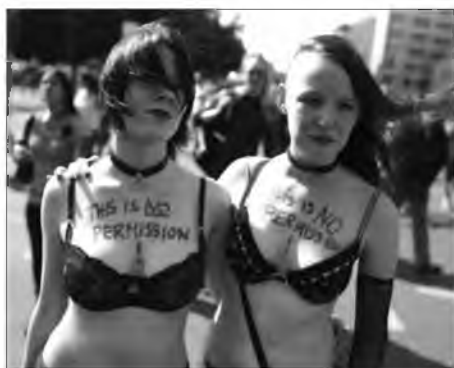
Це НЕ дозвіл!