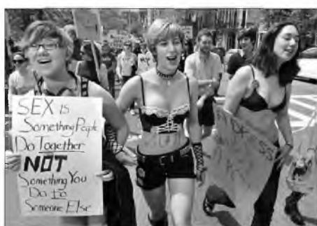
Секс — це щось, що люди роблять разом, а не щось, що ти робиш комусь. Сукня не означає "так".

9.1. Світлини з маршів "Хода шльондр" у різних містах світу, 2011–2012 рр.