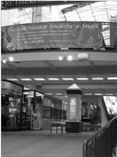
9.4. Банер повідомляє, що в університеті діє Центр допомоги постраждалим від сексуальної агресії. Університет Альберти, Едмонтон, Канада, 2009 рік

насилля, психологічну підтримку та юридичну допомогу. Діяльність, спрямована на попередження статевого насилля, є і громадською ініціативою (мал. 9.2), і частиною офіційної університетської політики (див. мал. 9.3, 9.4).