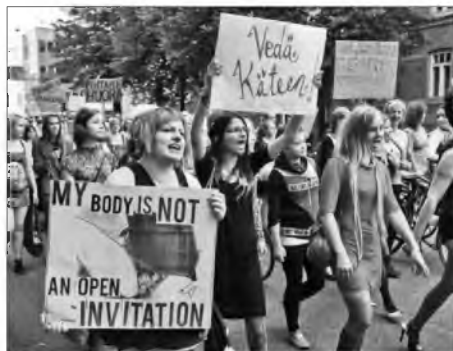
Моє тіло – це не відкрите запрошення!