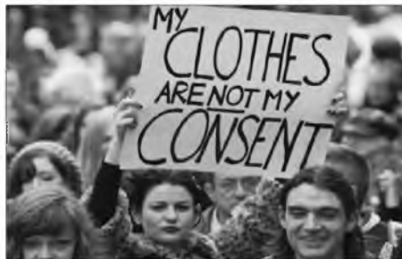
Мій одяг не означає згоду