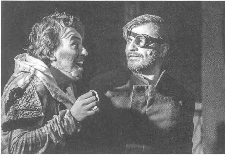
Сцена з вистави «Гамлет» за В. Шекспіром. Режисер Ростислав Держипільський. Івано-Франківський музично-драматичний театр ім. І. Франка.

За задумом Ростислава Держипільського, персонажі цієї відомої шекспірівської історії вже мерці, які звиваються в пекельних муках за вчинені у минулому гріхи. Тому тиші-спокою протягом вистави по суті немає: вирують пристрасті політичні, економічні, військові, особисті, сімейні, сексуальні тощо. Актори грають на високих нотах, часто переходячи в крик і волання. Тож режисер створив справжній апокаліпсис світу: жалюгідне і нище існування-муки людей, ніби безхребетних черв'яків під землею. І надії на порятунок для них не залишив.