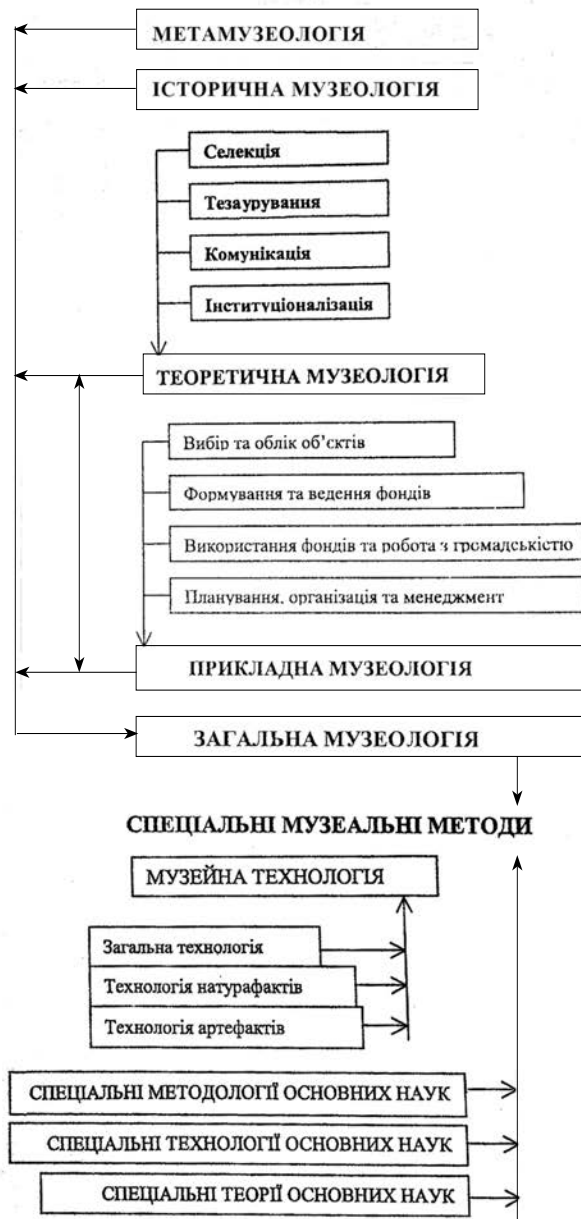
Рис. 1. Система музеології (за Ф. Вайдахером)

Розглянемо ще одне з трактувань музейної педагогіки, а саме як суміжної наукової дисципліни, яка досліджує музейні форми комунікації, характер використання музейних засобів у переданні та сприйнятті інформації з погляду педагогіки [9; див. також: 15, с. 68]. Як предмет музейної педагогіки розглядають проблеми, пов'язані зі змістом, методами і формами педагогічного впливу музею, з особливостями його впливу на різні категорії населення, а також визначення місця музею в системі установ культури [9]. Зважаючи на це, ми знову вбачаємо багато спільного з методикою культурно-освітньої діяльності . Чи залишається дискусійним питання належності музейної педагогіки як окремого структурного елементу до системи музеології (музезнавства)?