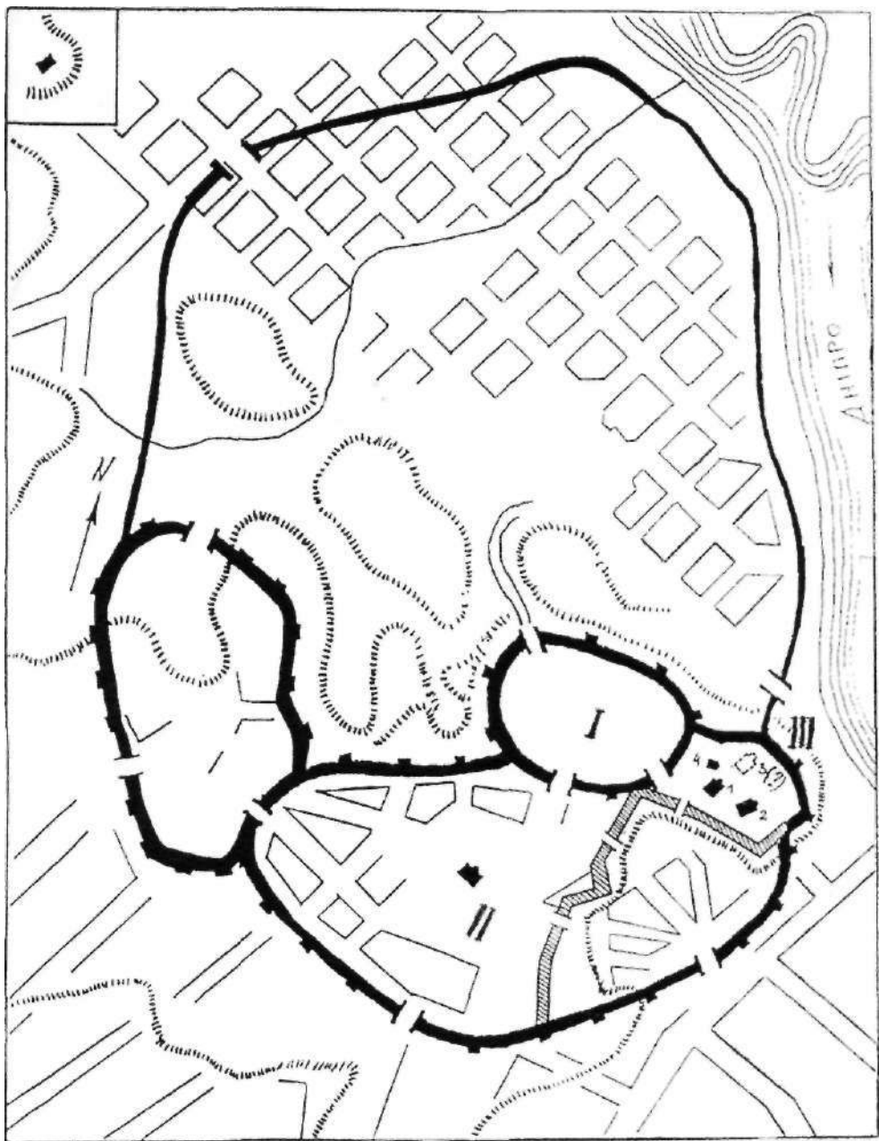
Рис. 1. Схема укріплень Верхнього Києва: